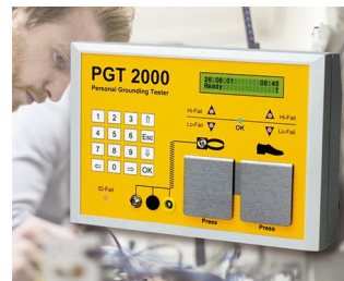
System for preventing electrostatic charges