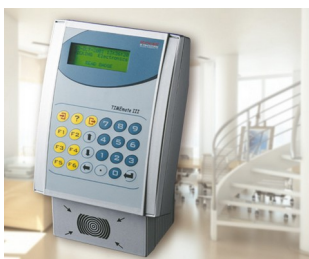
Terminal for time recording, access control and order management