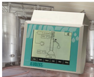
Device for monitoring and controlling distillation units