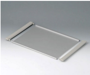
B4130126 Profile plate L Aluminium matt anodised 302x220x8mm