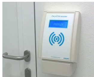
RFID access control readers