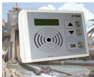
Versatile terminal for leisure facilities