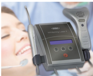
Dental Whitening and laser therapy

Systémy pro sběr dat na pracovišti a na strojích, přístupové kontroly, systémy řeči a sledování, zdravotnická technika, zdravotní péče, měření, ovládání, regulace, topení a klimatizace, atd.