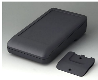
A9007208 DATEC-COMPACT L ASA+PC (UL 94 V-0) lava 206x110x47mm IP 65