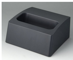
A9107508 Sockel L ASA+PC (UL 94 V-0) lava