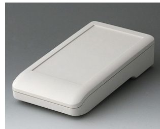
A9006117 DATEC-COMPACT M ASA+PC (UL 94 V-0) grauweiß RAL 9002 172x92x39mm IP 41