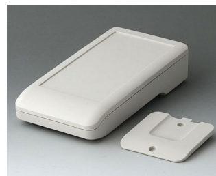
A9006217 DATEC-COMPACT M ASA+PC (UL 94 V-0) grauweiß RAL 9002 172x92x39mm IP 41