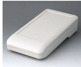
A9007117 DATEC-COMPACT L ASA+PC (UL 94 V-0) grauweiß RAL 9002 206x110x47mm IP 41