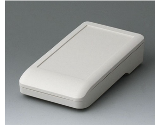
A9005117 DATEC-COMPACT S ASA+PC (UL 94 V-0) grauweiß RAL 9002 136x74x32mm IP 41