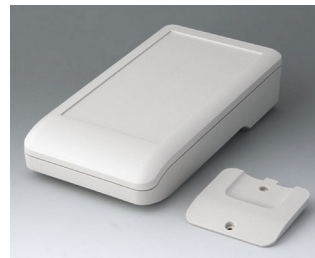
A9007217 DATEC-COMPACT L ASA+PC (UL 94 V-0) grauweiß RAL 9002 206x110x47mm IP 41