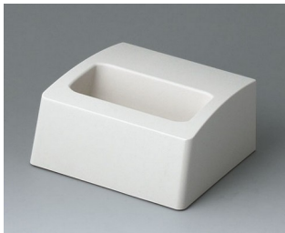
A9105507 Sockel S ASA+PC (UL 94 V-0) grauweiß RAL 9002