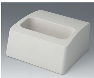
A9107507 Sockel L ASA+PC (UL 94 V-0) grauweiß RAL 9002