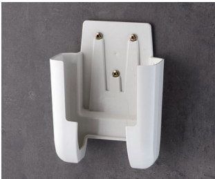
A9107627 Halter L ASA+PC (UL 94 V-0) grauweiß RAL 9002