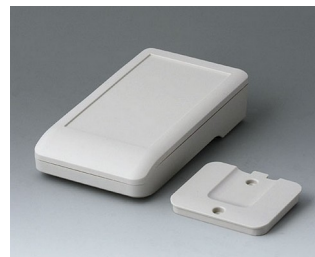
A9005217 DATEC-COMPACT S ASA+PC (UL 94 V-0) grauweiß RAL 9002 136x74x32mm IP 41