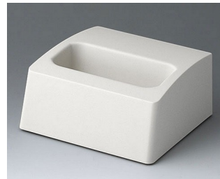
A9106507 Sockel M ASA+PC (UL 94 V-0) grauweiß RAL 9002