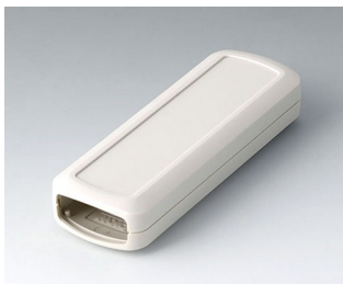
B2824107 CONNECT S ASA+PC (UL 94 V-0) grauweiß RAL 9002 120x42x22mm