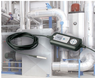
Prozessüberwachung mit Temperatursensor