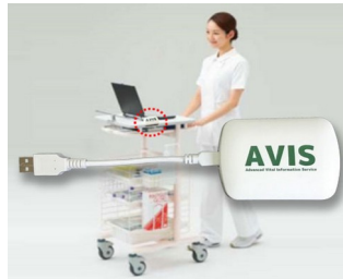
Receiver zur Datenübertragung in elektronische Krankenakte