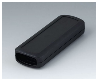
B2824109 CONNECT S ASA+PC (UL 94 V-0) schwarz RAL 9005 120x42x22mm