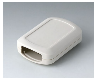
B2832107 CONNECT M ASA+PC (UL 94 V-0) grauweiß RAL 9002 76x54x22mm