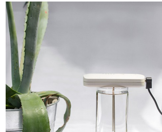
Herstellung kolloidaler Silberlösung