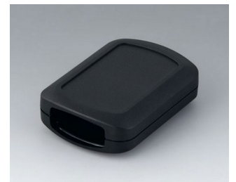
B2832109 CONNECT M ASA+PC (UL 94 V-0) schwarz RAL 9005 76x54x22mm