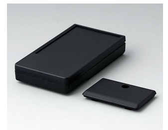
A9071219 DATEC-POCKET-BOX M PMMA (IR) (UL 94 HB) schwarz RAL 9005 105x58x18,5mm IP 54