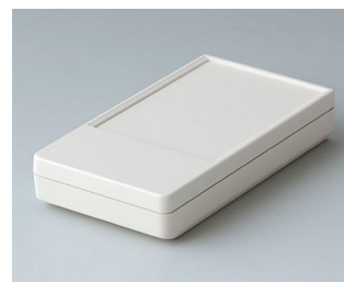
A9070117 DATEC-POCKET-BOX S ABS (UL 94 HB) grauweiß RAL 9002 85x46x16mm IP 54