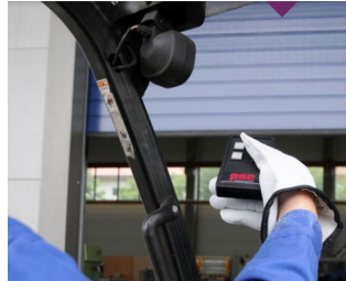
IR-Fernbedienung für raue Umgebung