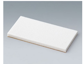
A9250251 Distanzteil PE-Zellschaumstoff 50x25x3mm