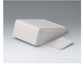
B4054237 UNITEC S, 0,6/1,4 ABS (UL 94 HB) grauweiß RAL 9002 125x177x69mm IP 40