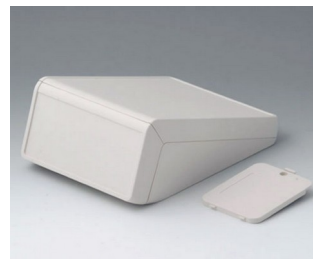
B4056227 UNITEC M, 1,4/0,6 ABS (UL 94 HB) grauweiß RAL 9002 148x210x80mm IP 40