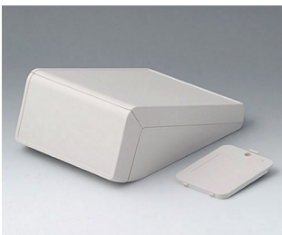
B4056207 UNITEC M, 0,6/0,6 ABS (UL 94 HB) grauweiß RAL 9002 148x210x80mm IP 40