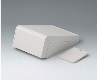
B4054207 UNITEC S, 0,6/0,6 ABS (UL 94 HB) grauweiß RAL 9002 125x177x69mm IP 40