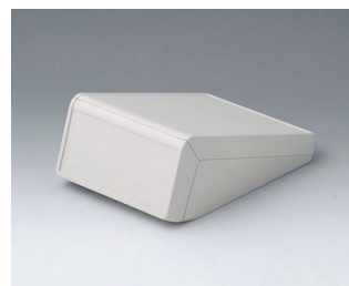
B4054127 UNITEC S, 1,4/0,6 ABS (UL 94 HB) grauweiß RAL 9002 125x177x69mm IP 40