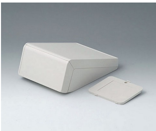
B4054307 UNITEC S, 0,6/0,6 ABS (UL 94 HB) grauweiß RAL 9002 125x177x69mm IP 40