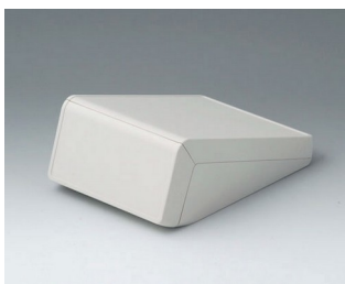
B4054107 UNITEC S, 0,6/0,6 ABS (UL 94 HB) grauweiß RAL 9002 125x177x69mm IP 40