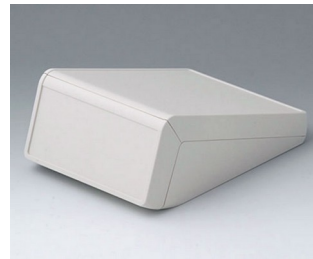
B4056127 UNITEC M, 1,4/0,6 ABS (UL 94 HB) grauweiß RAL 9002 148x210x80mm IP 40