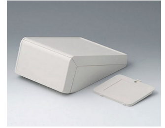
B4056337 UNITEC M, 0,6/1,4 ABS (UL 94 HB) grauweiß RAL 9002 148x210x80mm IP 40