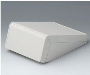
B4056107 UNITEC M, 0,6/0,6 ABS (UL 94 HB) grauweiß RAL 9002 148x210x80mm IP 40