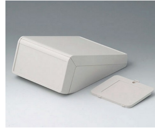
B4056327 UNITEC M, 1,4/0,6 ABS (UL 94 HB) grauweiß RAL 9002 148x210x80mm IP 40