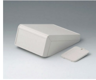
B4054227 UNITEC S, 1,4/0,6 ABS (UL 94 HB) grauweiß RAL 9002 125x177x69mm IP 40