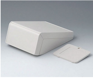
B4056307 UNITEC M, 0,6/0,6 ABS (UL 94 HB) grauweiß RAL 9002 148x210x80mm IP 40