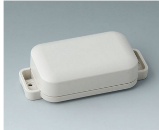
C3204207 EASYTEC 80 ASA+PC (UL 94 V-0) grauweiß RAL 9002 101x50x26mm IP 65 opt., IP 40