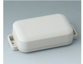
C3206207 EASYTEC 100 ASA+PC (UL 94 V-0) grauweiß RAL 9002 121x62x31mm IP 65 opt., IP 40