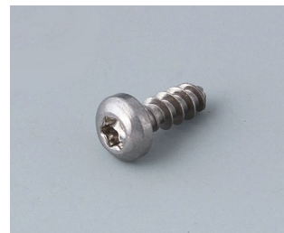
A0308132 Selbstformende Schraube 3 x 8 mm (T10) Edelstahl

Technische Änderungen vorbehalten. © OKW Gehäusesysteme, Buchen/Deutschland.