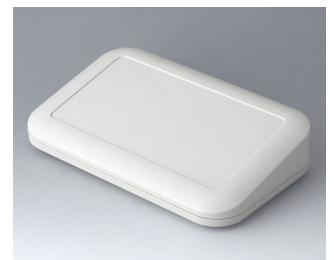
A9466107 EVOTEC 200, Ausf. III ASA+PC (UL 94 V-0) grauweiß RAL 9002 200x124x45mm IP 65 opt., IP 40