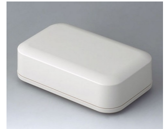
A9443107 EVOTEC 150, Ausf. I ASA+PC (UL 94 V-0) grauweiß RAL 9002 150x93x45mm IP 65 opt., IP 40