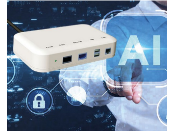
Schnittstelle für smarte Systeme