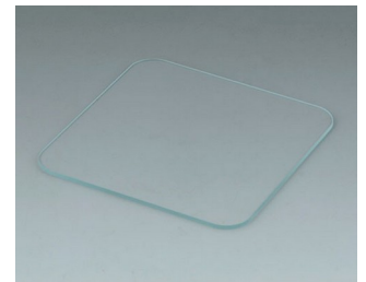
C6502013 Glasscheibe S84 Glas glasklar 78,75x78,75x1,6mm