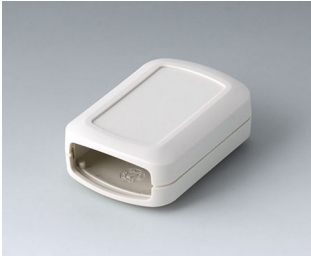
B2822107 CONNECT S ASA+PC (UL 94 V-0) off-white RAL 9002 60x42x22mm