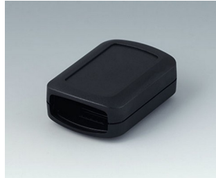
B2822109 CONNECT S ASA+PC (UL 94 V-0) black RAL 9005 60x42x22mm