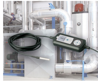
Process monitoring with temperature sensor