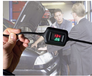
Voltage and current display during trickle charging