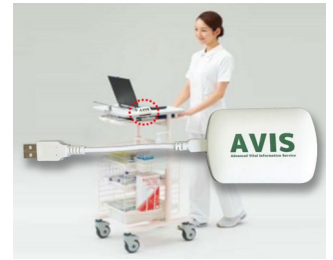
Receiver and data transfer for EMR