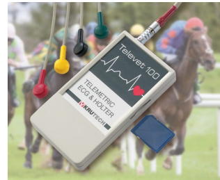
Telemetric ECG system for veterinary medicine