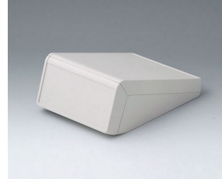
B4054127 UNITEC S, 1.4/0.6 ABS (UL 94 HB) off-white RAL 9002 125x177x69mm IP 40