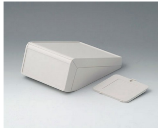
B4054317 UNITEC S, 1.4/1.4 ABS (UL 94 HB) off-white RAL 9002 125x177x69mm IP 40