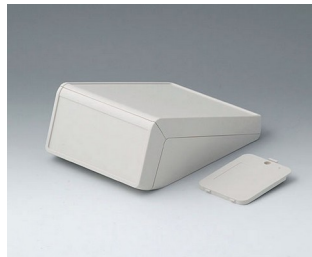
B4054217 UNITEC S, 1.4/1.4 ABS (UL 94 HB) off-white RAL 9002 125x177x69mm IP 40