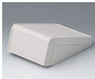
B4056117 UNITEC M, 1.4/1.4 ABS (UL 94 HB) off-white RAL 9002 148x210x80mm IP 40