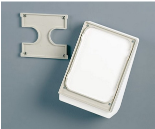
B4154307 Wall suspension element S off-white RAL 9002