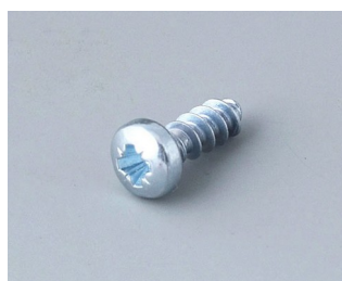
A0308031 Self-tapping screws 3 x 8 mm (PZ1)