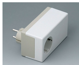
A9022465 PLUG CASE D, Vers. II PC+ABS (UL 94 V-0) pebble grey RAL 7032 120x65x55mm