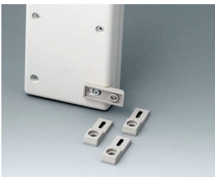
A9204108 Wall mounting brackets PA 6 pebble grey RAL 7032