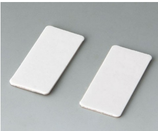
A9305147 Adhesive foil holder

Nos reservamos el derecho a realizar modificaciones técnicas.