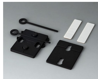
A9305019 Wall suspension elements ASA+PC (UL 94 V-0) black RAL 9005