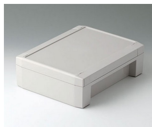
C8017222 SOLID-BOX 175 PC+ABS (UL 94 V-0) light grey RAL 7035 225x175x70mm IP 66, IP 67, IK 08