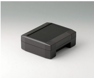
C8011131 SOLID-BOX 115 PC+ABS (UL 94 V-0) anthracite grey RAL 7016 135x115x50mm IP 66, IP 67, IK 08