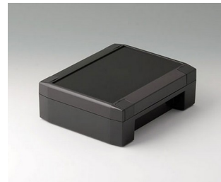
C8014181 SOLID-BOX 145 PC+ABS (UL 94 V-0) anthracite grey RAL 7016 180x145x60mm IP 66, IP 67, IK 08