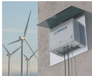
Controller wind turbines