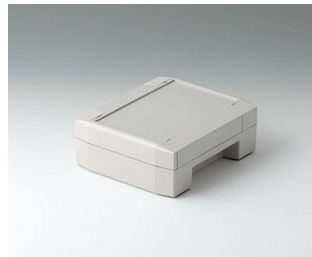
C8011132 SOLID-BOX 115 PC+ABS (UL 94 V-0) light grey RAL 7035 135x115x50mm IP 66, IP 67, IK 08