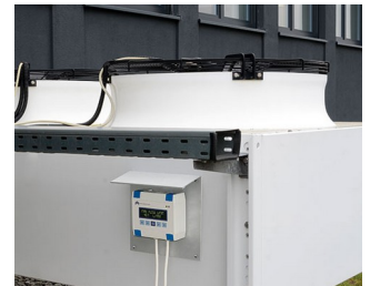
Heating/air conditioning/ventilation control