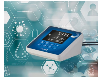
Laboratory measuring device