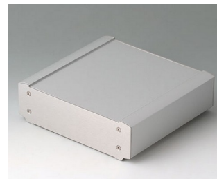
B3407013 SMART-TERMINAL 160 Aluminium AlMgSi 0,5 anodisé mat 164x170x50mm