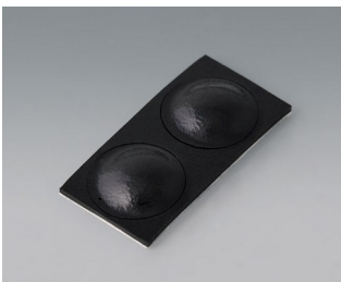
A9209229 Pieds anti-glissant 8,5 x 2,2 mm noir

Sous réserve de modifications techniques. © OKW Gehäusesysteme, Buchen/Allemagne.