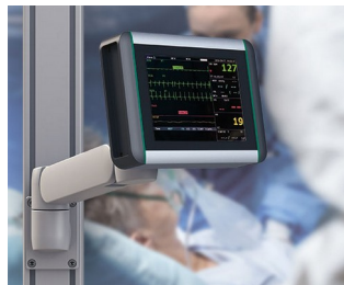
Moniteur de surveillance des signes vitaux