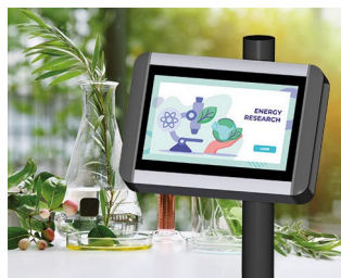
Terminal de recherche végétale