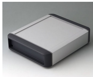
B3407012 SMART-TERMINAL 160 Aluminium AlMgSi 0,5 anodisé mat 202x170x50mm IP 54