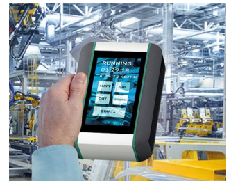
Système de surveillance en temps réel de la machine