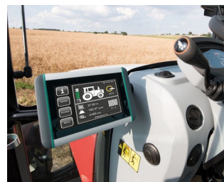
Terminal ISOBUS pour tracteurs et machines agricoles