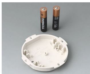
B5111107 Logement de pile, 2 x AAA ABS (UL 94 HB) gris blanc RAL 9002