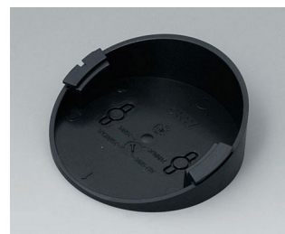
B5011219 Socle 30° ABS (UL 94 HB) noir RAL 9005