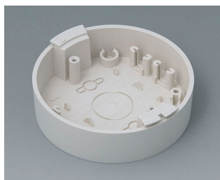
B5011117 Socle ABS (UL 94 HB) gris blanc RAL 9002