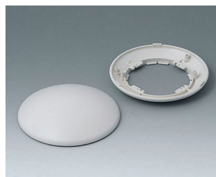
B5010107 Partie inférieure et supérieure R110 H ABS (UL 94 HB) gris blanc RAL 9002 ø110x38mm