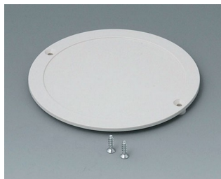
B5011857 Couverture du compartiment piles ABS (UL 94 HB) gris blanc RAL 9002