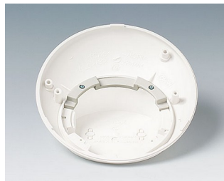
B5111707 Protection antitorsion ABS (UL 94 HB) gris blanc RAL 9002