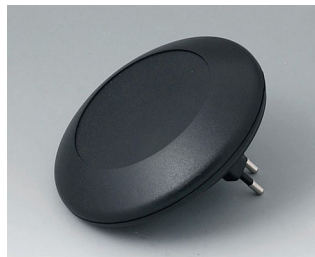
B5011229 ART-CASE R110 F PC+ABS (UL 94 V-0) noir RAL 9005 ø110x38mm IP 40