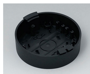
B5011119 Socle ABS (UL 94 HB) noir RAL 9005