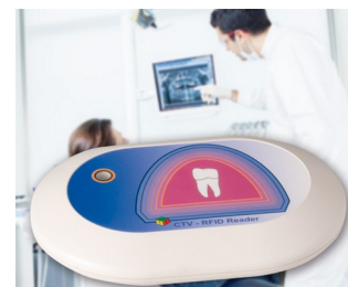
Lecteur RFID pour système CTV