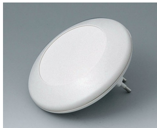
B5011227 ART-CASE R110 F PC+ABS (UL 94 V-0) gris blanc RAL 9002 ø110x38mm IP 40