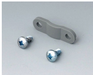
A9199005 Décharge de traction PA 6 volcan