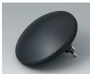
B5011329 ART-CASE R110 H PC+ABS (UL 94 V-0) noir RAL 9005 ø110x41mm IP 40