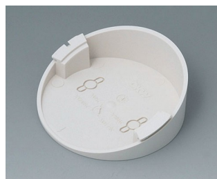
B5011217 Socle 30° ABS (UL 94 HB) gris blanc RAL 9002