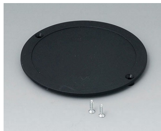
B5011859 Couverture du compartiment piles ABS (UL 94 HB) noir RAL 9005