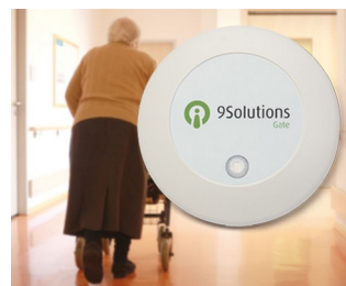
Gestion et contrôle d'accès