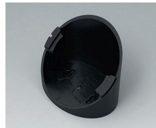
B5011319 Socle 55° ABS (UL 94 HB) noir RAL 9005