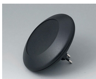
B5011029 ART-CASE R110 F PC+ABS (UL 94 V-0) noir RAL 9005 ø110x30mm IP 40