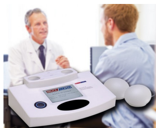
Système multiple d'analyse de résonances