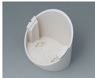
B5011317 Socle 55° ABS (UL 94 HB) gris blanc RAL 9002