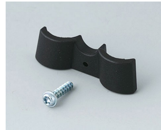
A9166003 Support de pile, 2 x AAA PA 6 (UL 94 HB) noir RAL 9005