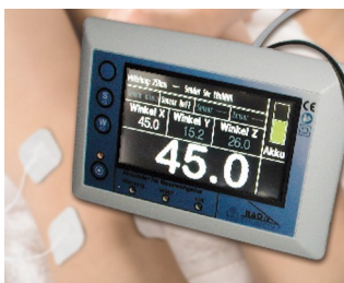
Mesure d'angle en 3D de systèmes d'articulations sur la base de la gravité