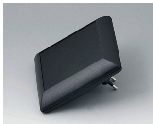
B5013229 ART-CASE S110 F PC+ABS (UL 94 V-0) noir RAL 9005 110x110x38mm IP 40