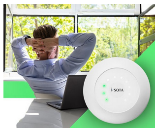
Feu de signalisation CO2 à capteur