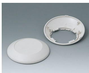
B5010207 Partie inférieure et supérieure R110 F ABS (UL 94 HB) gris blanc RAL 9002 ø110x38mm