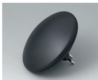
B5011129 ART-CASE R110 H PC+ABS (UL 94 V-0) noir RAL 9005 ø110x38mm IP 40