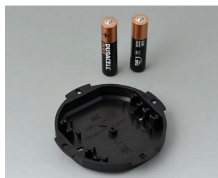
B5111109 Logement de pile, 2 x AAA ABS (UL 94 HB) noir RAL 9005