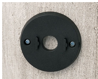
B5111309 Jeu de support mural ABS (UL 94 HB) noir RAL 9005