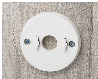
B5111307 Jeu de support mural ABS (UL 94 HB) gris blanc RAL 9002