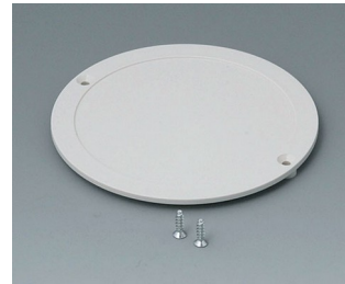
B5011847 Couvercle ABS (UL 94 HB) gris blanc RAL 9002