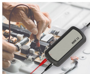
Interface pour sondes de test dans les applications PC