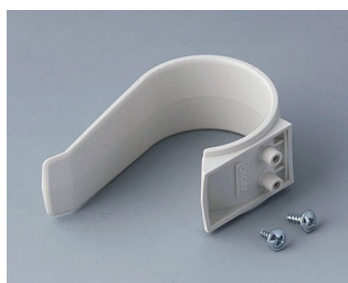
A9167027 Étrier de retenue PA 6 (UL 94 HB) gris blanc RAL 9002