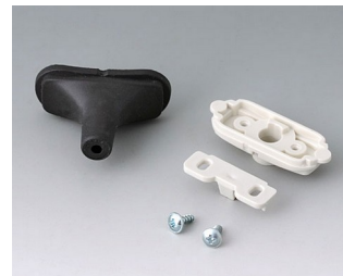
B2911309 Kit passe-câbles, 3,4 - 4,2 TPE noir RAL 9005