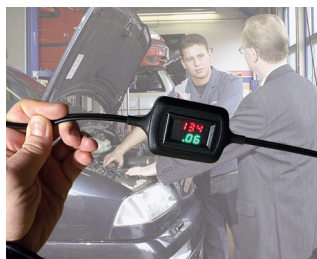
Affichage de la tension et du courant en mode maintien de charge

Périphérique d'ordinateurs, technique de réseau, technique des bâtiments, technique de sécurité, IoT/ IIoT, applications médicales et thérapeutiques, instruments d'analyse en laboratoire, technique de mesure, entre autres détecteurs avec sonde de mesure, systèmes/instruments de test, enregistreurs de données dans la technique environnementale, produits de technique énergétique et sensorique, etc.