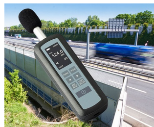
Mesure du niveau de bruit