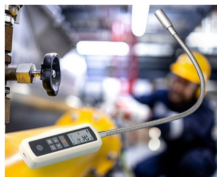
Détecteur de fuite de gaz