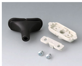
B2911319 Kit passe-câbles, 4,2 - 5,0 TPE noir RAL 9005