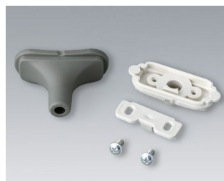
B2911328 Kit passe-câbles, 5,0 - 5,9 TPE volcan