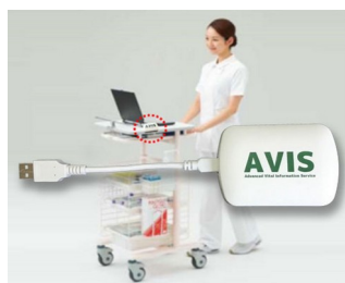
Récepteur pour la transmission de données