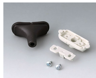
B2911329 Kit passe-câbles, 5,0 - 5,9 TPE noir RAL 9005