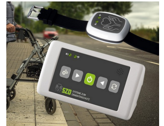
Solution de sécurisation des personnes vulnérables