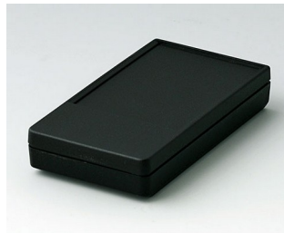
A9070219 DATEC-POCKET-BOX S PMMA (IR) (UL 94 HB) noir RAL 9005 85x46x16mm IP 54