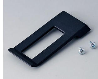
A9172109 Clip de poche ABS (UL 94 HB) noir RAL 9005 62x30mm