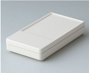
A9070107 DATEC-POCKET-BOX S ABS (UL 94 HB) gris blanc RAL 9002 85x46x16mm IP 41