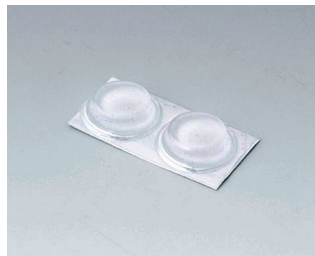
A9212330 Pieds anti-glissant 12 x 3,5 mm transparent

Sous réserve de modifications techniques. © OKW Gehäusesysteme, Buchen/Allemagne.