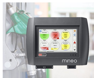
Contrôleur pour la gestion intelligente du réservoir