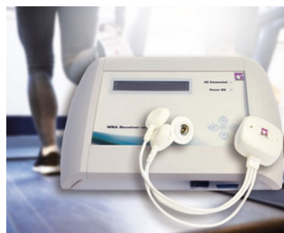
Unité réceptrice WBA pour la mesure de signaux biologiques