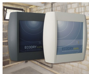
Systèmes de déshumidification des murs