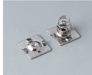
A9190015 Ressorts de contact, 2 x AA Acier nickelé