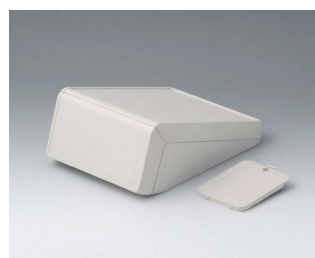
B4054237 UNITEC S, 0,6/1,4 ABS (UL 94 HB) gris blanc RAL 9002 125x177x69mm IP 40