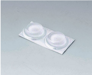
A9212330 Pieds anti-glissant 12 x 3,5 mm transparent

Sous réserve de modifications techniques. © OKW Gehäusesysteme, Buchen/Allemagne.