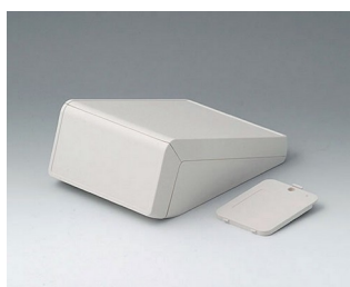
B4054207 UNITEC S, 0,6/0,6 ABS (UL 94 HB) gris blanc RAL 9002 125x177x69mm IP 40