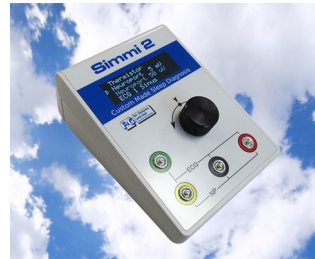
Simulateur de signal biologique