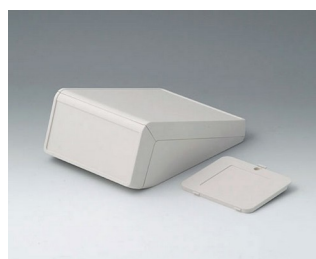
B4054327 UNITEC S, 1,4/0,6 ABS (UL 94 HB) gris blanc RAL 9002 125x177x69mm IP 40