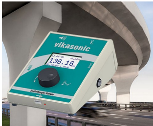
Appareil de mesure à ultrasons

Systèmes de saisie de données, terminaux d'accès et d'information, domotique, périphériques d'ordinateur, communication, applications d'analyse, de diagnostic et de thérapie, technique de mesure et de régulation et commandes industrielles.