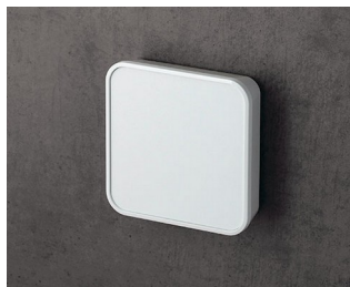
C6402107 SMART-PANEL S84 ASA+PC (UL 94 V-0) blanc signalisation RAL 9016 84x84x21,3mm IP 40