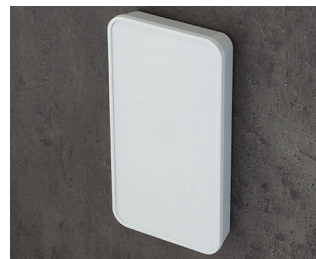
C6406107 SMART-PANEL E155 ASA+PC (UL 94 V-0) blanc signalisation RAL 9016 155x84x21,3mm IP 40