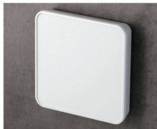
C6404107 SMART-PANEL S114 ASA+PC (UL 94 V-0) blanc signalisation RAL 9016 114x114x21,3mm IP 40