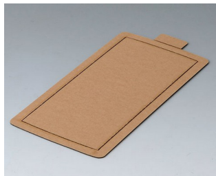
B5503300 Feuille adhésive M