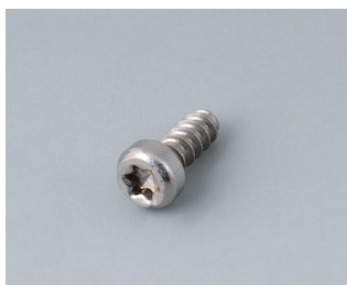
A0325060 Vis autotaraudeuse 2,5 x 6 mm (T8) Acier inoxydable

Sous réserve de modifications techniques. © OKW Gehäusesysteme, Buchen/Allemagne.