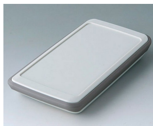
B5403317 SLIM-CASE M, Vers. VI ASA+PC (UL 94 V-0) gris blanc RAL 9002 148x74x22mm IP 54