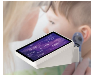
Appareil de test auditif