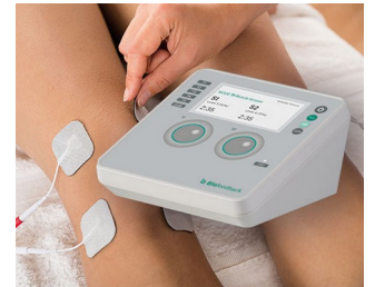
Compteur de biofeedback