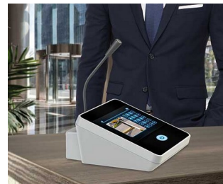
Microphone de table / interphone