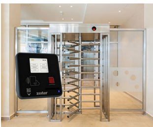
Terminal pour le contrôle d'accès