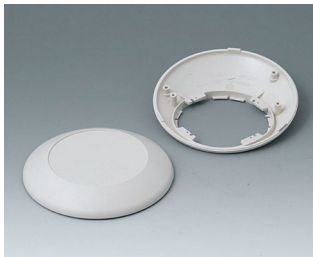
B5010207 Bottom and top part R110 F ABS (UL 94 HB) off-white RAL 9002 ø110x38mm