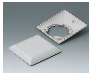
B5012207 Bottom and top part S110 F ABS (UL 94 HB) off-white RAL 9002 110x110x38mm