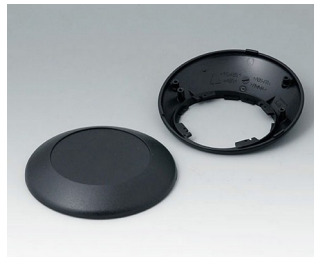
B5010209 Bottom and top part R110 F ABS (UL 94 HB) black RAL 9005 ø110x38mm