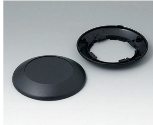
B5010009 Bottom and top part R110 F ABS (UL 94 HB) black RAL 9005 ø110x30mm