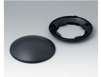
B5010109 Bottom and top part R110 H ABS (UL 94 HB) black RAL 9005 ø110x38mm