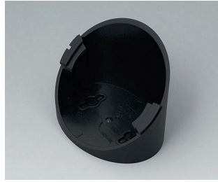
B5011319 Base 55° ABS (UL 94 HB) black RAL 9005