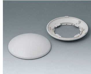
B5010107 Bottom and top part R110 H ABS (UL 94 HB) off-white RAL 9002 ø110x38mm