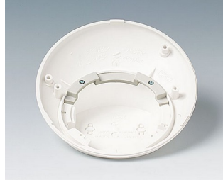
B5111707 Anti-rotation device ABS (UL 94 HB) off-white RAL 9002