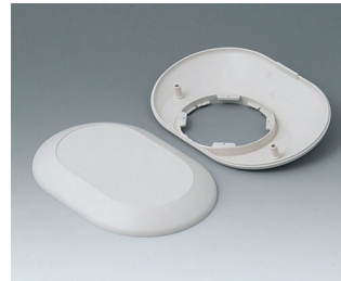
B5015207 Bottom and top part O160 F ABS (UL 94 HB) off-white RAL 9002 160x110x38mm