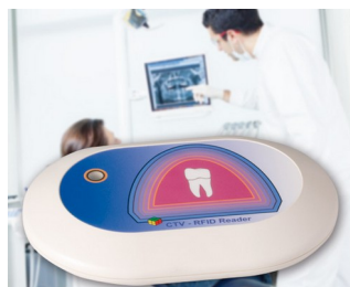
RFID Reader for the CTV system