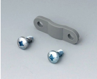
A9199005 Strain relief PA 6 volcano