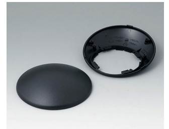
B5010309 Bottom and top part R110 H ABS (UL 94 HB) black RAL 9005 ø110x41mm