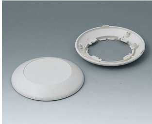
B5010007 Bottom and top part R110 F ABS (UL 94 HB) off-white RAL 9002 ø110x30mm