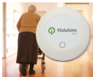
Access management in care facilities