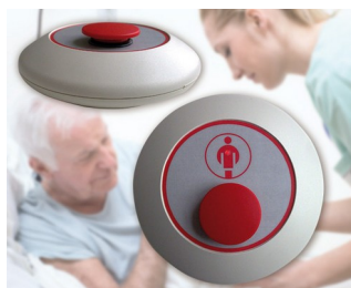
Radio paging mushroom-type button