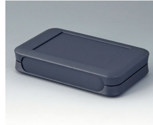
A9052108 SOFT-CASE L ABS (UL 94 HB) lava 73x117x24mm IP 54 opt., IP 40