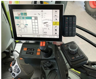
Digital joystick for ISO bus machines

Diverse tipologie di comandi a distanza, senza fili o tramite cavo, metrologia e tecnica di regolazione, tecnica di comando digitale, tecnica medica e di laboratorio, periferiche e dispositivi interfaccia, tecnica di comunicazione, IoT/IIoT, ecc.