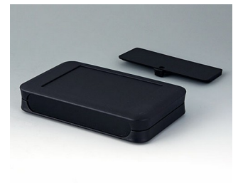
A9053219 SOFT-CASE XL PMMA (IR) (UL 94 HB) black RAL 9005 92x150x28mm IP 40