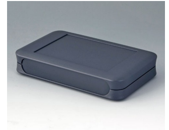
A9053108 SOFT-CASE XL ABS (UL 94 HB) lava 92x150x28mm IP 40