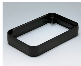
A9152219 Intermediate ring L PMMA (IR) (UL 94 HB) black RAL 9005 76x120x21mm