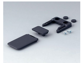
A9152048 Combi-Clip ABS (UL 94 HB) lava 45x27mm