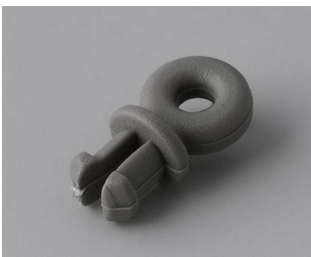
A9100001 Ring eyelet PA 6 volcano