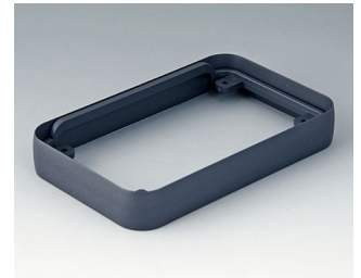
A9151018 Intermediate ring M ABS (UL 94 HB) lava 68x108x16mm