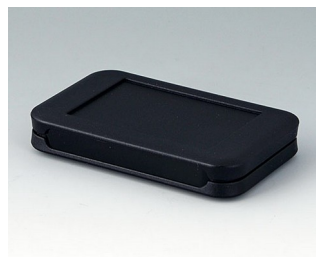
A9050209 SOFT-CASE S PMMA (IR) (UL 94 HB) black RAL 9005 51x82x14mm IP 54 opt., IP 40