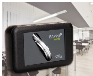
Sensor for measuring carbon dioxide concentration