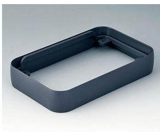
A9152018 Intermediate ring L ABS (UL 94 HB) lava 76x120x21mm