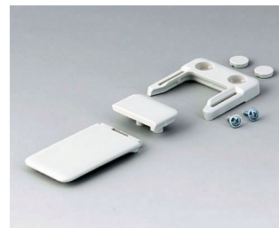
A9152047 Combi-Clip ABS (UL 94 HB) off-white RAL 9002 45x27mm