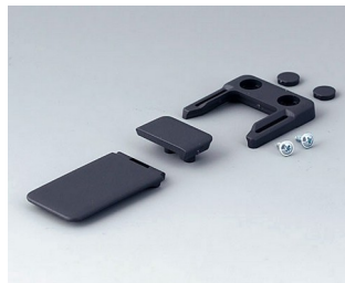
A9152048 Combi-Clip ABS (UL 94 HB) lava 45x27mm