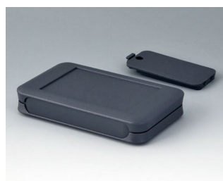
A9051118 SOFT-CASE M ABS (UL 94 HB) lava 65x105x19mm IP 40