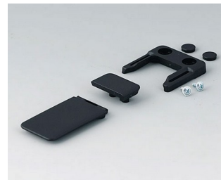
A9152049 Combi-Clip ABS (UL 94 HB) black RAL 9005 45x27mm