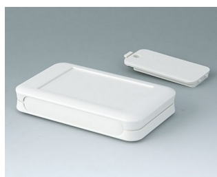
A9051117 SOFT-CASE M ABS (UL 94 HB) off-white RAL 9002 65x105x19mm IP 40