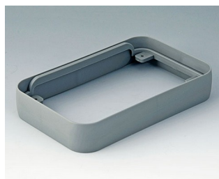
A9152118 Intermediate protection ring L SEBS (TPE) volcano 76x120x21mm