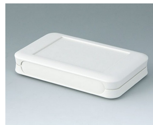
A9051107 SOFT-CASE M ABS (UL 94 HB) off-white RAL 9002 65x105x19mm IP 54 opt., IP 40