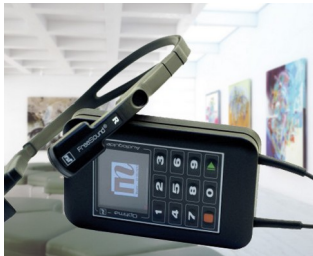
Multimedia audioguide for museums