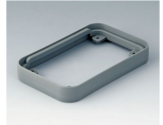
A9150118 Intermediate protection ring S SEBS (TPE) volcano 54x85x12mm