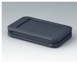
A9050108 SOFT-CASE S ABS (UL 94 HB) lava 51x82x14mm IP 54 opt., IP 40