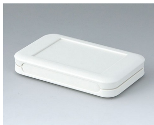
A9050107 SOFT-CASE S ABS (UL 94 HB) off-white RAL 9002 51x82x14mm IP 54 opt., IP 40