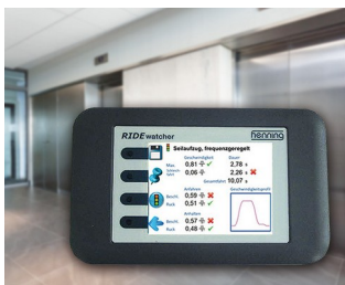
RIDEwatcher Multimeter for ride profiles