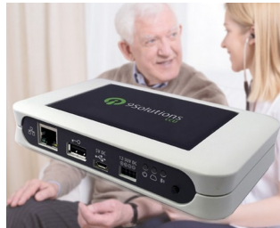
Real-time localisation in the healthcare sector