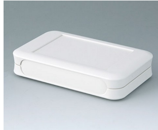
A9052107 SOFT-CASE L ABS (UL 94 HB) off-white RAL 9002 73x117x24mm IP 54 opt., IP 40