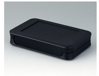
A9052209 SOFT-CASE L PMMA (IR) (UL 94 HB) black RAL 9005 73x117x24mm IP 54 opt., IP 40