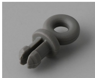
A9100002 Ring eyelet PA 6 volcano