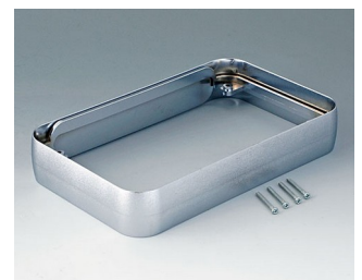
A9153011 Intermediate ring XL ABS (UL 94 HB) matt chromed 96x154x26mm