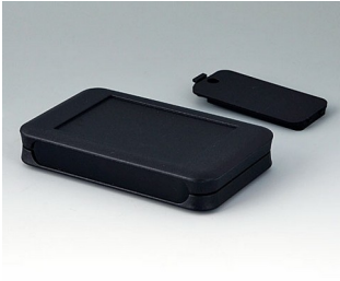
A9051219 SOFT-CASE M PMMA (IR) (UL 94 HB) black RAL 9005 65x105x19mm IP 40