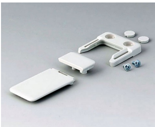
A9152047 Combi-Clip ABS (UL 94 HB) off-white RAL 9002 45x27mm