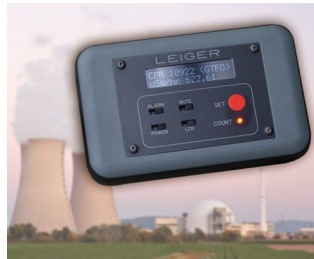
Geiger counter with logging function