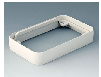
A9152017 Intermediate ring L ABS (UL 94 HB) off-white RAL 9002 76x120x21mm