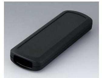
B2834109 CONNECT M ASA+PC (UL 94 V-0) black RAL 9005 156x54x22mm