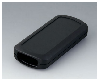
B2833109 CONNECT M ASA+PC (UL 94 V-0) black RAL 9005 116x54x22mm