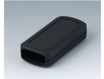
B2823109 CONNECT S ASA+PC (UL 94 V-0) black RAL 9005 90x42x22mm