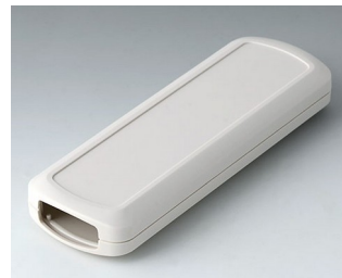
B2834107 CONNECT M ASA+PC (UL 94 V-0) off-white RAL 9002 156x54x22mm