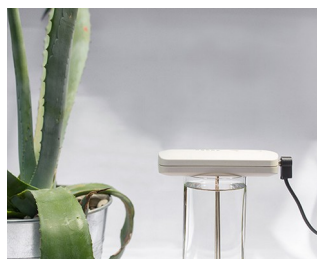
Tool for making colloidal silver solutions