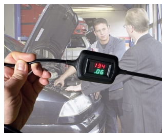
Voltage and current display during trickle charging