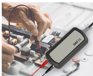
Test probe interface for PC applications