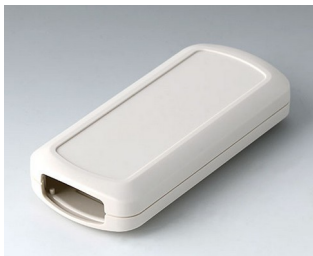
B2833107 CONNECT M ASA+PC (UL 94 V-0) off-white RAL 9002 116x54x22mm