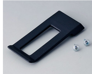
A9172109 Belt/Pocket clip ABS (UL 94 HB) black RAL 9005 62x30mm