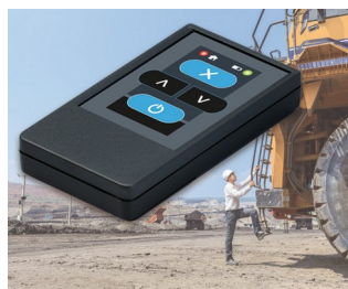
Radio transmitter for machines