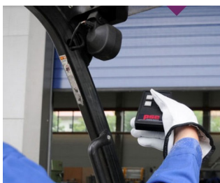
IR remote control for harsh environments

Ideale per generatori e ricevitori di impulsi, metrologia e tecnologia di regolazione, generatori di impulsi per ultrasuoni e raggi infrarossi, svariate tipologie di comandi a distanza, comunicazione senza fili, rilevamento mobile di dati, ecc.