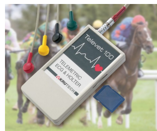
Telemetric ECG system for veterinary medicine