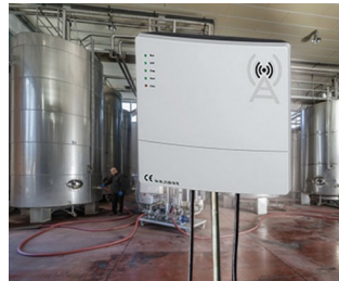
Gateway for the automation of production plants