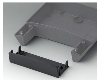
B3318918 Infill cover 180 ASA+PC (UL 94 V-0) lava