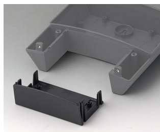
B3314918 Infill cover 140 ASA+PC (UL 94 V-0) lava