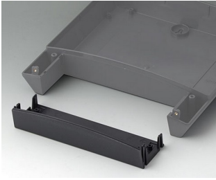
B3322918 Infill cover 220 ASA+PC (UL 94 V-0) lava