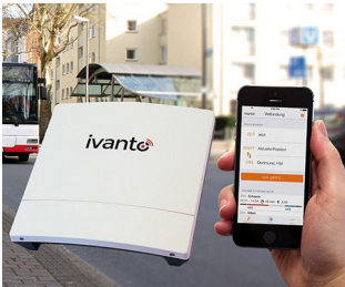
IT for urban mobility