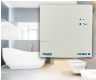
Esystop flow water stop system

Gestione degli impianti tecnici di edifici, centraline di controllo, IoT/IIoT, smart factory, industrie 4.0, impianti di monitoraggio e controllo degli accessi, sistemi di rilevamento dati, periferiche di computer, metrologia e tecnica di regolazione, tecnica medica, ecc.