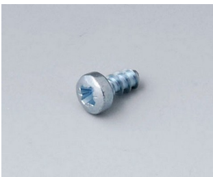
A0306031 Self-tapping screws 3 x 6 mm (PZ1)