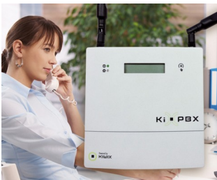
Telecommunications station for independent professionals