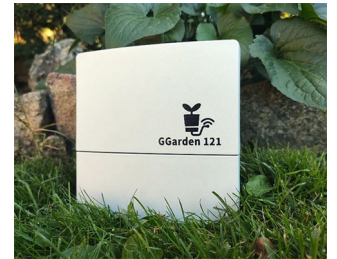
Intelligent Irrigation System