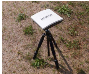
Measuring station for stationary field measurements