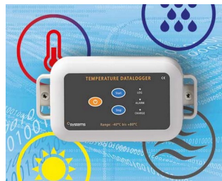
Data logger e.g. for temperature