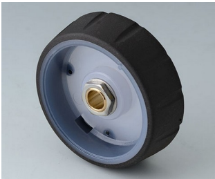
B7146061 CONTROL-KNOBS 46, optional illumination PC nero 46x14,7mm 6mm