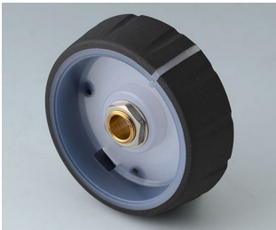
B7246061 CONTROL-KNOBS 46, optional illumination PC nero 46x14,7mm 6mm