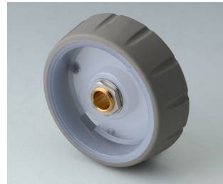
B7146063 CONTROL-KNOBS 46, optional illumination PC volcano 46x14,7mm 6mm