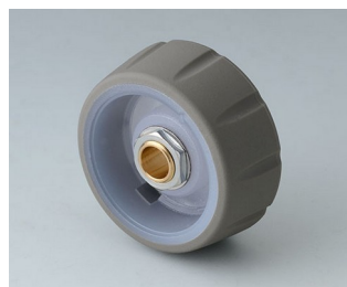
B7136063 CONTROL-KNOBS 36, optional illumination PC volcano 36x14,7mm 6mm