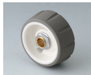
B7136064 CONTROL-KNOBS 36 PC volcano 36x14,7mm 6mm