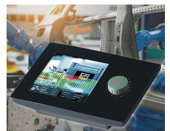
Measured value display device