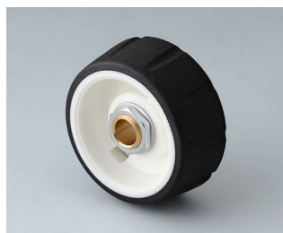
B7136062 CONTROL-KNOBS 36 PC nero 36x14,7mm 6mm