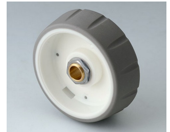
B7146064 CONTROL-KNOBS 46 PC volcano 46x14,7mm 6mm