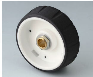
B7146062 CONTROL-KNOBS 46 PC nero 46x14,7mm 6mm