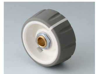
B7236064 CONTROL-KNOBS 36 PC volcano 36x14,7mm 6mm