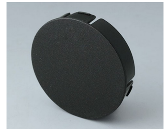
B7546109 Cover 46 PA 6 nero