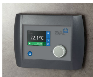
Solar Control Panel