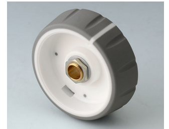
B7246064 CONTROL-KNOBS 46 PC volcano 46x14,7mm 6mm