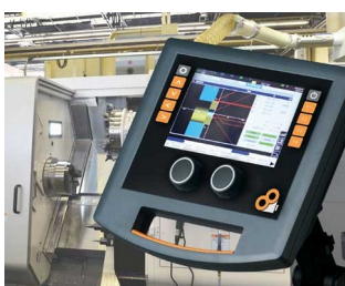
Operating elements for machine control