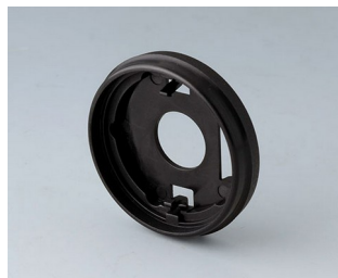
B7536209 Base 36 PA 6 nero