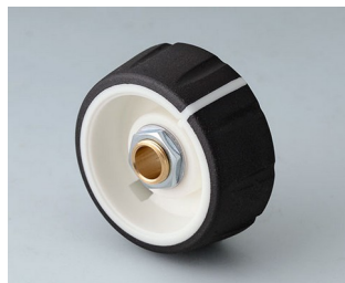
B7236062 CONTROL-KNOBS 36 PC nero 36x14,7mm 6mm