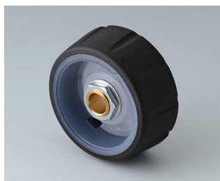
B7136061 CONTROL-KNOBS 36, optional illumination PC nero 36x14,7mm 6mm