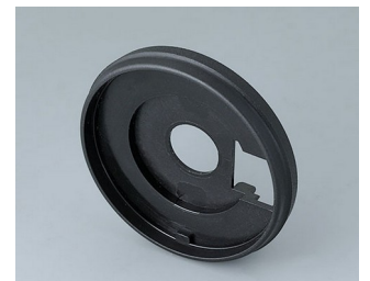
B7546209 Base 46 PA 6 nero