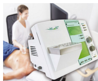
Operating element for a diagnostic device