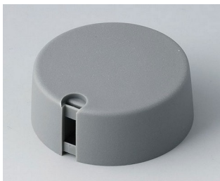
A1040648 TOP-KNOBS 40 PA 6 volcano 40x16mm