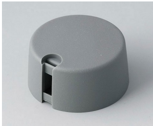
A1031648 TOP-KNOBS 31 PA 6 volcano 31x16mm