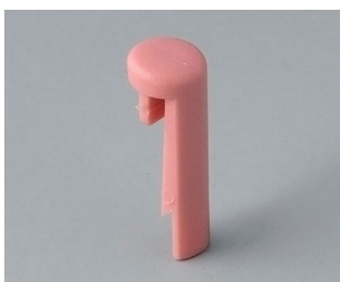
A1101003 Pin PA 6 (UL 94 HB) coral