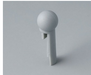
A1102007 Globe PA 6 (UL 94 HB) mineral