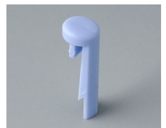
A1101006 Pin PA 6 (UL 94 HB) sky