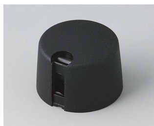
A1024649 TOP-KNOBS 24 PA 6 nero 24x16mm