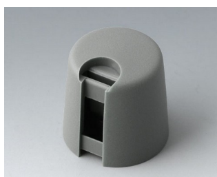
A1016648 TOP-KNOBS 16 PA 6 volcano 16x16mm