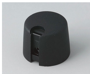
A1020649 TOP-KNOBS 20 PA 6 nero 20x16mm