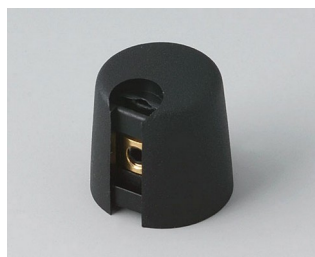
A1016049 TOP-KNOBS 16 PA 6 nero 16x16mm 4mm