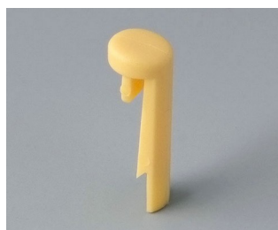
A1101004 Pin PA 6 (UL 94 HB) beach