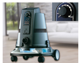
Operating element for a vacuum cleaner