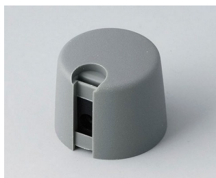
A1020648 TOP-KNOBS 20 PA 6 volcano 20x16mm