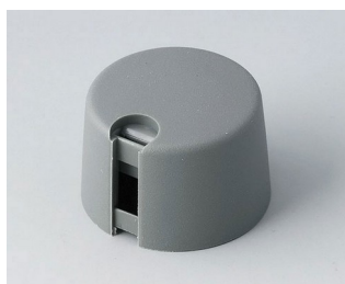
A1024648 TOP-KNOBS 24 PA 6 volcano 24x16mm