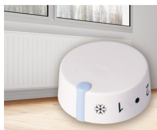
Integrated thermostat for electric storage heaters