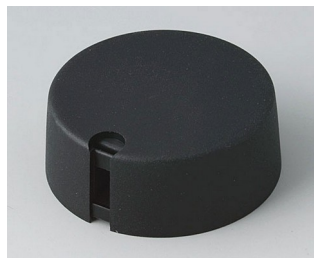
A1040649 TOP-KNOBS 40 PA 6 nero 40x16mm