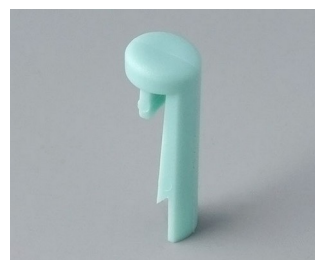
A1101005 Pin PA 6 (UL 94 HB) lagoon