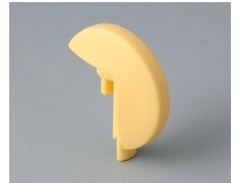
A1103004 Disk PA 6 (UL 94 HB) beach