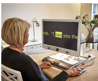
Control knobs for video magnifier

Per potenziometri rotanti con estremità arrotondate dell'albero secondo DIN 41591 o estremità appiattite \varnothing 6/4,6 mm. Metrologia e tecnica di regolazione, tecnica medica e di laboratorio, wellness, health care, tecnica di riscaldamento e di condizionamento dell'aria, comunicazione, edifici, ecc.