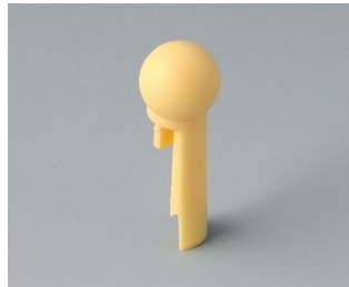
A1102004 Globe PA 6 (UL 94 HB) beach