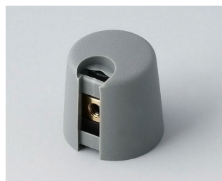
A1016068 TOP-KNOBS 16 PA 6 volcano 16x16mm 6mm