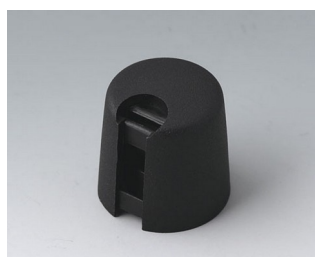
A1016649 TOP-KNOBS 16 PA 6 nero 16x16mm