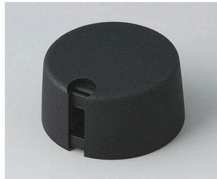
A1031649 TOP-KNOBS 31 PA 6 nero 31x16mm