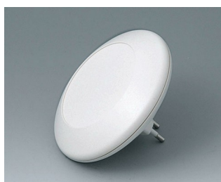
B5011027 ART-CASE R110 F PC+ABS (UL 94 V-0) off-white RAL 9002 ø110x30mm IP 40