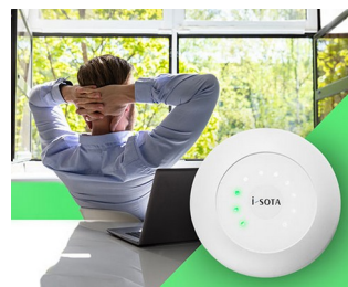
CO2 sensor traffic light