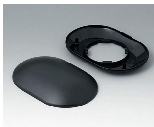
B5015109 Bottom and top part O160 H ABS (UL 94 HB) black RAL 9005 160x110x38mm