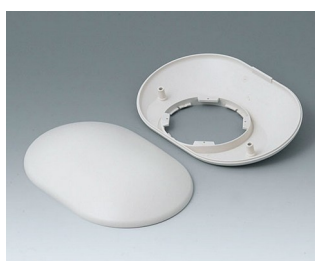
B5015307 Bottom and top part O160 H ABS (UL 94 HB) off-white RAL 9002 160x110x41mm