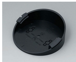
B5011219 Base 30° ABS (UL 94 HB) black RAL 9005