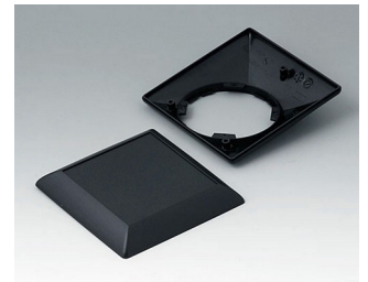
B5012209 Bottom and top part S110 F ABS (UL 94 HB) black RAL 9005 110x110x38mm