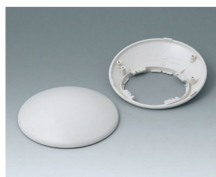
B5010307 Bottom and top part R110 H ABS (UL 94 HB) off-white RAL 9002 ø110x41mm