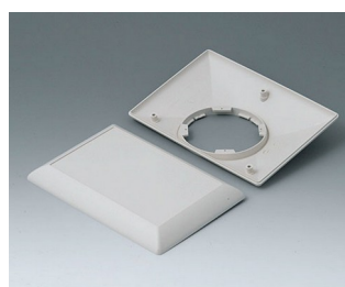
B5017207 Bottom and top part E160 F ABS (UL 94 HB) off-white RAL 9002 160x110x38mm