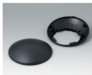
B5010309 Bottom and top part R110 H ABS (UL 94 HB) black RAL 9005 ø110x41mm