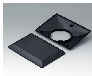
B5017209 Bottom and top part E160 F ABS (UL 94 HB) black RAL 9005 160x110x38mm