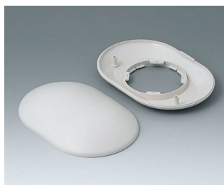
B5015107 Bottom and top part O160 H ABS (UL 94 HB) off-white RAL 9002 160x110x38mm