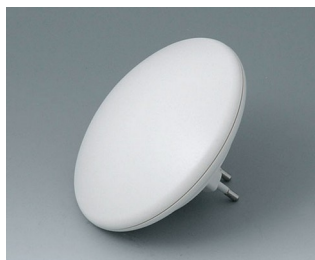
B5011127 ART-CASE R110 H PC+ABS (UL 94 V-0) off-white RAL 9002 ø110x38mm IP 40