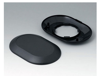
B5015009 Bottom and top part O160 F ABS (UL 94 HB) black RAL 9005 160x110x30mm