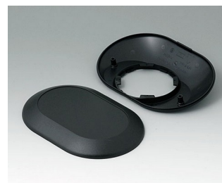
B5015209 Bottom and top part O160 F ABS (UL 94 HB) black RAL 9005 160x110x38mm