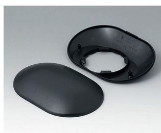
B5015309 Bottom and top part O160 H ABS (UL 94 HB) black RAL 9005 160x110x41mm