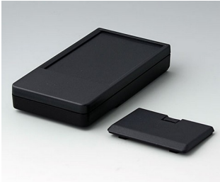
A9072229 DATEC-POCKET-BOX L PMMA (IR) (UL 94 HB) black RAL 9005 120x65x22mm IP 41