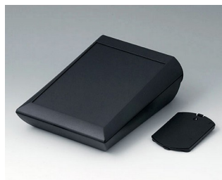
A0615119 COMTEC 150 H, Vers. II ABS (UL 94 HB) black RAL 9005 150x200x71,5mm IP 40