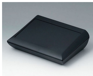
A0620109 COMTEC 200 H, Vers. I ABS (UL 94 HB) black RAL 9005 200x150x62,8mm IP 40