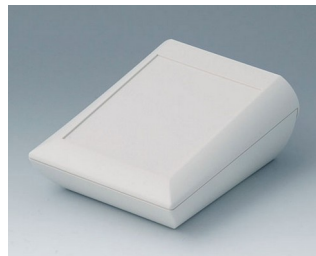
A0612107 COMTEC 120 H, Vers. I ABS (UL 94 HB) off-white RAL 9002 120x150x62,8mm IP 40