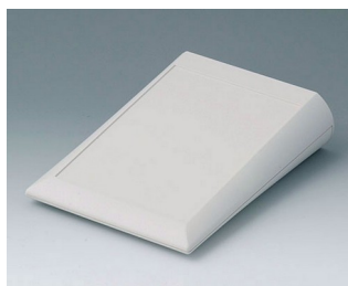
A0615007 COMTEC 150 F, Vers. I ABS (UL 94 HB) off-white RAL 9002 150x200x51,5mm IP 40