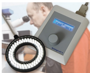
Controller for LED lighting in image processing and microscopy

Terminale do pobierania danych, urządzenia komunikacyjne, kontrola dostępu, bezpieczeństwo, medyczne, laboratoryjne, opieka zdrowotna, systemy sprzedaży, pomiar i sterowanie, rozporządzenie przemysłowe, itp.