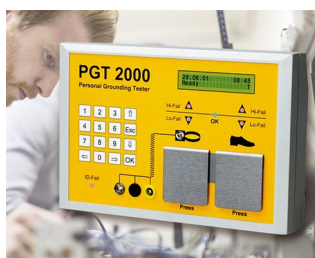
System for preventing electrostatic charges