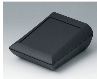
A0612109 COMTEC 120 H, Vers. I ABS (UL 94 HB) black RAL 9005 120x150x62,8mm IP 40