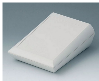
A0615107 COMTEC 150 H, Vers. I ABS (UL 94 HB) off-white RAL 9002 150x200x71,5mm IP 40