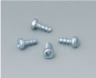
A9199008 Set of screws

Subject to technical modification without notice.