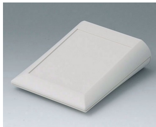
A0612007 COMTEC 120 F, Vers. I ABS (UL 94 HB) off-white RAL 9002 120x150x42,8mm IP 40