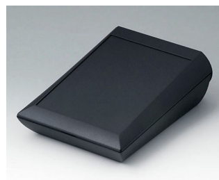
A0615109 COMTEC 150 H, Vers. I ABS (UL 94 HB) black RAL 9005 150x200x71,5mm IP 40