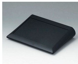
A0620009 COMTEC 200 F, Vers. I ABS (UL 94 HB) black RAL 9005 200x150x42,8mm IP 40