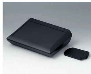
A0620119 COMTEC 200 H, Vers. II ABS (UL 94 HB) black RAL 9005 200x150x62,8mm IP 40