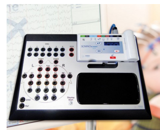
Stationary system for long-term EEG recordings