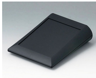
A0612009 COMTEC 120 F, Vers. I ABS (UL 94 HB) black RAL 9005 120x150x42,8mm IP 40