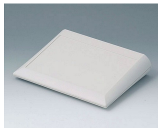
A0620007 COMTEC 200 F, Vers. I ABS (UL 94 HB) off-white RAL 9002 200x150x42,8mm IP 40