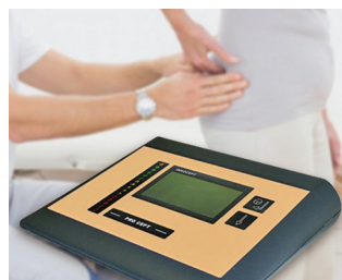
EMG bio-feedback for incontinence diagnostics and therapy