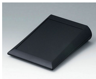
A0615009 COMTEC 150 F, Vers. I ABS (UL 94 HB) black RAL 9005 150x200x51,5mm IP 40