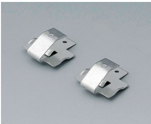
A9174006 Set of battery clips, 1 x 9 V Steel tin-plated