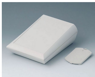
A0615117 COMTEC 150 H, Vers. II ABS (UL 94 HB) off-white RAL 9002 150x200x71,5mm IP 40