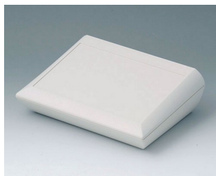
A0620107 COMTEC 200 H, Vers. I ABS (UL 94 HB) off-white RAL 9002 200x150x62,8mm IP 40