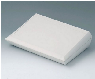
A0629107 COMTEC 290 H, Vers. I ABS (UL 94 HB) off-white RAL 9002 290x200x75,5mm IP 40