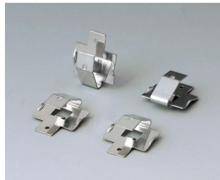
A9161002 Set of battery clips, 2 x 9 V or 4 x AA Steel tin-plated