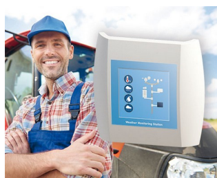
Weather Monitoring Station