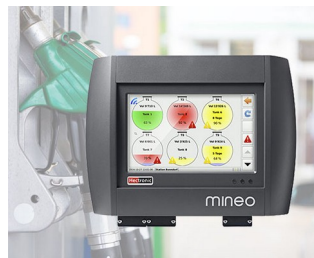
Controller for intelligent tank management