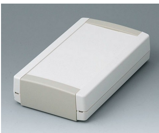
B1075365 TOPTec 194 F, Vers. I ABS (UL 94 HB) off-white RAL 9002 194x115x46mm IP 40