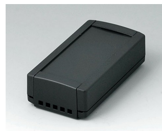
B1040469 TOPTEC 102, Vers. II ABS (UL 94 HB) black RAL 9005 102x54x30mm IP 40