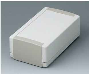
B1070365 TOPTec 194 H, Vers. I ABS (UL 94 HB) off-white RAL 9002 194x115x68mm IP 40