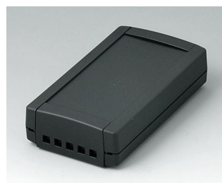
B1055469 TOPTEC 123 F, Vers. II ABS (UL 94 HB) black RAL 9005 123x68x30mm IP 40