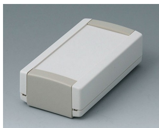
B1040365 TOPTEC 102, Vers. I ABS (UL 94 HB) off-white RAL 9002 102x54x30mm IP 40