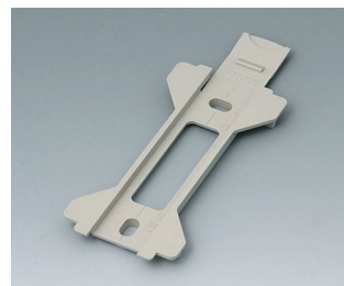
B1360028 Wall suspension element for Toptec 154 PC+ABS (UL 94 V-0) pebble grey RAL 7032