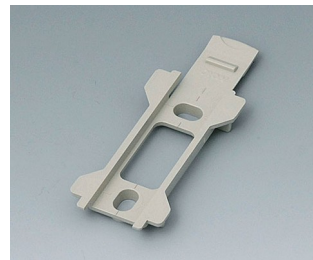
B1340028 Wall suspension element for Toptec 102 PC+ABS (UL 94 V-0) pebble grey RAL 7032