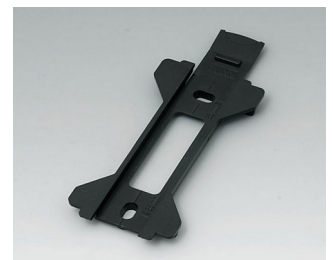
B1360029 Wall suspension element for Toptec 154 ABS (UL 94 HB) black RAL 9005