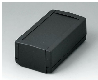
B1050369 TOPTEC 123 H, Vers. I ABS (UL 94 HB) black RAL 9005 123x68x45mm IP 40