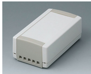
B1050465 TOPTEC 123 H, Vers. II ABS (UL 94 HB) off-white RAL 9002 123x68x45mm IP 40