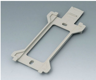
B1370028 Wall suspension element for Toptec 194 PC+ABS (UL 94 V-0) pebble grey RAL 7032