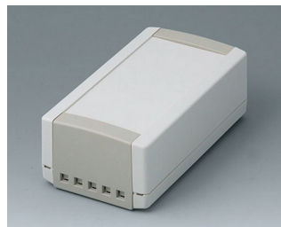
B1060465 TOPTEC 154 H, Vers. II ABS (UL 94 HB) off-white RAL 9002 154x84x56mm IP 40