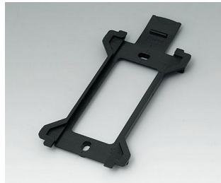
B1370029 Wall suspension element for Toptec 194 ABS (UL 94 HB) black RAL 9005