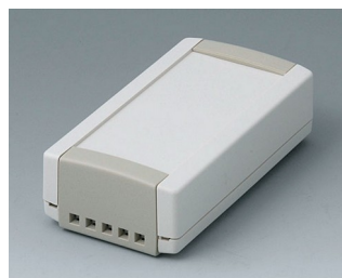
B1040465 TOPTEC 102, Vers. II ABS (UL 94 HB) off-white RAL 9002 102x54x30mm IP 40