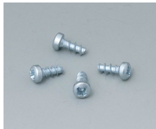
A9199008 Set of screws