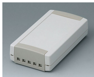
B1065465 TOPTEC 154 F, Vers. II ABS (UL 94 HB) off-white RAL 9002 154x84x38mm IP 40