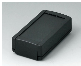
B1040369 TOPTEC 102, Vers. I ABS (UL 94 HB) black RAL 9005 102x54x30mm IP 40