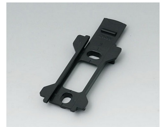
B1340029 Wall suspension element for Toptec 102 ABS (UL 94 HB) black RAL 9005