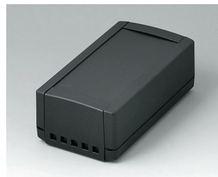
B1060469 TOPTEC 154 H, Vers. II ABS (UL 94 HB) black RAL 9005 154x84x56mm IP 40