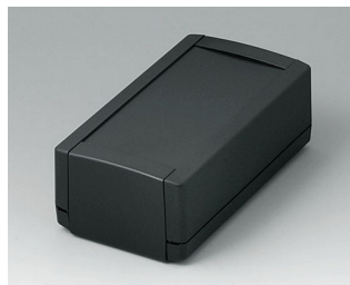
B1060369 TOPTEC 154 H, Vers. I ABS (UL 94 HB) black RAL 9005 154x84x56mm IP 40