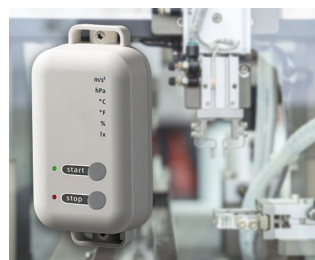
Data logger with gateway function