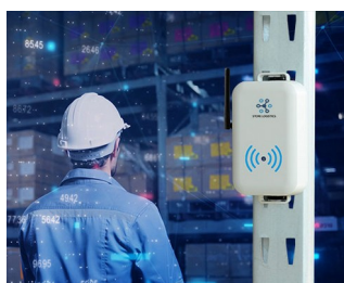
Smart store logistics