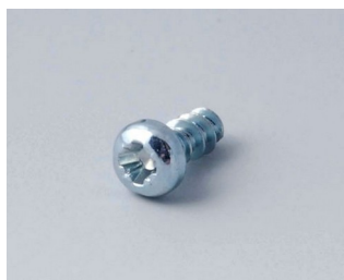
A0305031 Self-tapping screws 2.5 x 6 mm (PZ1)