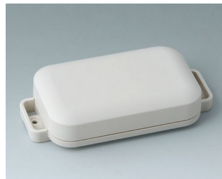
C3206107 EASYTEC 100 ASA+PC (UL 94 V-0) off-white RAL 9002 121x62x26mm IP 65 opt., IP 40