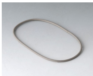
A9500030 Sealing 80