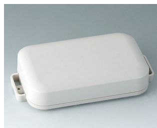
C3208107 EASYTEC 150 ASA+PC (UL 94 V-0) off-white RAL 9002 172x93x36mm IP 65 opt., IP 40