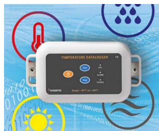
Data logger e.g. for temperature