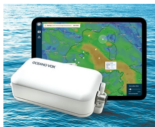
Data Collection for Ocean Observation network