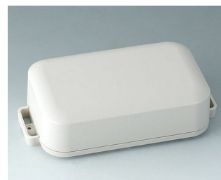
C3208207 EASYTEC 150 ASA+PC (UL 94 V-0) off-white RAL 9002 172x93x46mm IP 65 opt., IP 40