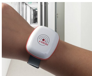
eEntry access and security controls