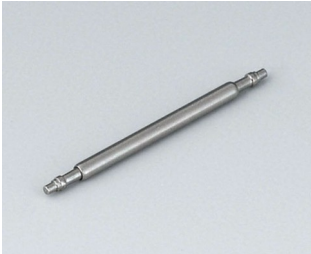
B1706206 Spring bar, Ø 1.5 x 19 mm Stainless steel