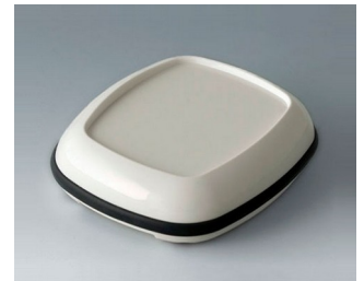
B1606217 BODY-CASE L, with recess ASA (UL 94 HB) traffic white RAL 9016 55x46x16mm IP 65