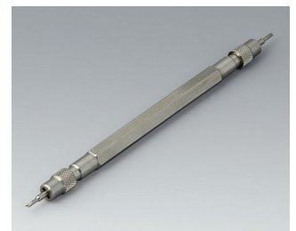
B1706203 Spring bar tool Stainless steel