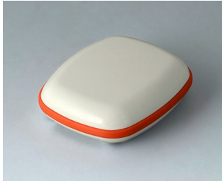
B1604107 BODY-CASE M, without recess ASA (UL 94 HB) traffic white RAL 9016 50x41x15mm IP 65