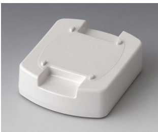
B1704017 Station M ASA (UL 94 HB) traffic white RAL 9016 62x50x17mm