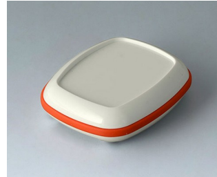
B1604207 BODY-CASE M, with recess ASA (UL 94 HB) traffic white RAL 9016 50x41x14mm IP 65