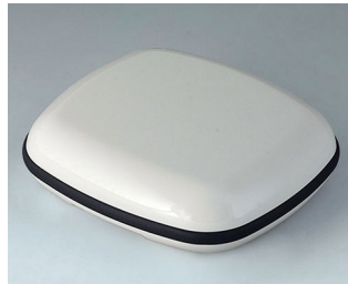
B1608117 BODY-CASE XL, without recess ASA (UL 94 HB) traffic white RAL 9016 62x56x18mm IP 65