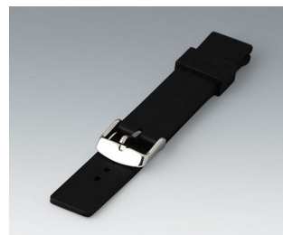
B1706202 Wrist strap, 18 mm Silicone black