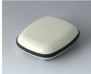
B1604117 BODY-CASE M, without recess ASA (UL 94 HB) traffic white RAL 9016 50x41x15mm IP 65