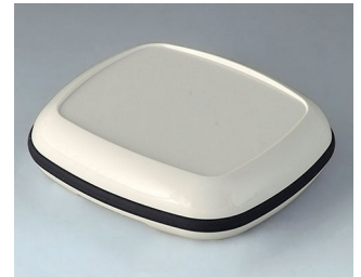
B1608217 BODY-CASE XL, with recess ASA (UL 94 HB) traffic white RAL 9016 62x56x17mm IP 65