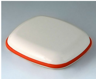
B1608107 BODY-CASE XL, without recess ASA (UL 94 HB) traffic white RAL 9016 62x56x18mm IP 65