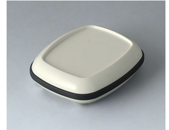
B1604217 BODY-CASE M, with recess ASA (UL 94 HB) traffic white RAL 9016 50x41x14mm IP 65