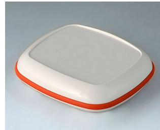
B1608207 BODY-CASE XL, with recess ASA (UL 94 HB) traffic white RAL 9016 62x56x17mm IP 65