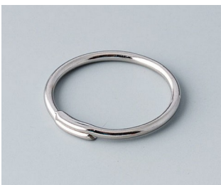
A9164001 Key ring Steel nickel-plated 20,5mm