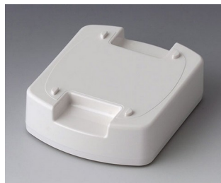
B1706017 Station L ASA (UL 94 HB) traffic white RAL 9016 62x50x17mm