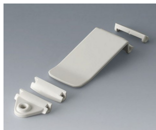
B1706001 Eyelet / pocket clip kit ASA (UL 94 HB) traffic white RAL 9016