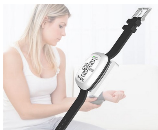
B-heal Hybrid Blood Zapper

Bezprzewodowe urządzenie zapisujące z transmisją danych, śledzenie i monitorowanie, wywołanie alarmowe oraz systemy powiadamiania, a także czujniki bio do monitorowania stanu zdrowia, technologie medyczne, terapeutycznych i społecznych dziedzinach. Wearables, IoT/ IIoT, systemy połączeń alarmowych i powiadomień, sprzęt do śledzenia i monitorowania, czujniki bio-sprzężenia zwrotnego w dziedzinie opieki zdrowotnej, technologii medycznej, w dziedzinach terapeutycznych i społecznych, wypoczynek i sport, technologii komunikacji, sprzedaży akcji i rejestrowania, inżynierii bezpieczeństwa, techniki sterowania i automatyzacji, praca, gdzie wymagana jest lokalizacja.