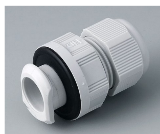
C2320717 Quick fix cable gland, M20 PA 6 light grey RAL 7035