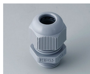
C2316418 Cable gland M16x1.5 PA 6 silver grey RAL 7001