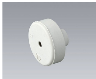
C2312137 Cable grommet EPDM light grey RAL 7035