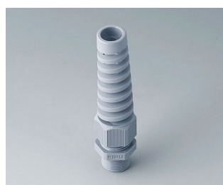
C2320528 Cable gland M20x1.5, bending protection PA 6 silver grey RAL 7001