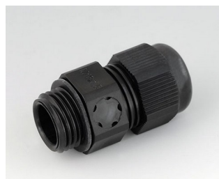
C2316919 Cable gland M16x1.5, pressure compensation PA 6 (UL 94 V-0) black RAL 9005