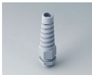
C2316518 Cable gland M16x1.5, bending protection PA 6 silver grey RAL 7001