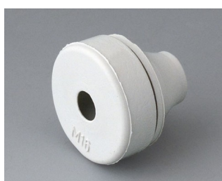
C2316137 Cable grommet EPDM light grey RAL 7035