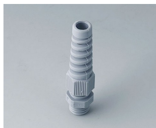
C2312518 Cable gland M12x1.5, bending protection PA 6 silver grey RAL 7001