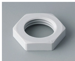
C2316117 Counternut M16x1.5 PA 6 light grey RAL 7035