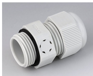
C2320917 Cable gland M20x1.5, pressure compensation PA 6 (UL 94 V-0) light grey RAL 7035