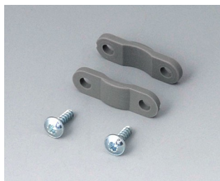
A9166004 Set of pull-relief PA 6 volcano