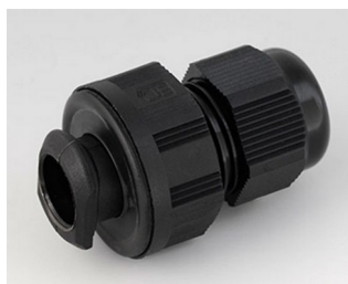
C2316719 Quick fix cable gland, M16 PA 6 black RAL 9005