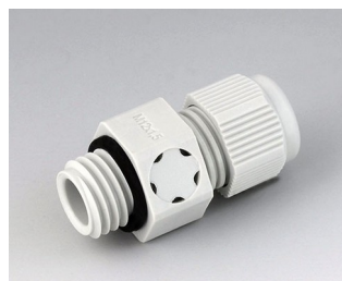
C2312917 Cable gland M12x1.5, pressure compensation PA 6 (UL 94 V-0) light grey RAL 7035