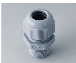
C2320428 Cable gland M20x1.5 PA 6 silver grey RAL 7001