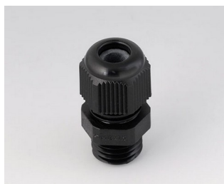
C2312419 Cable gland M12x1.5 PA 6 black RAL 9005