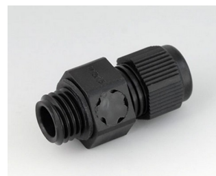
C2312919 Cable gland M12x1.5, pressure compensation PA 6 (UL 94 V-0) black RAL 9005