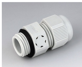
C2316917 Cable gland M16x1.5, pressure compensation PA 6 (UL 94 V-0) light grey RAL 7035