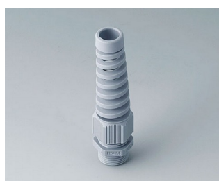
C2320518 Cable gland M20x1.5, bending protection PA 6 silver grey RAL 7001