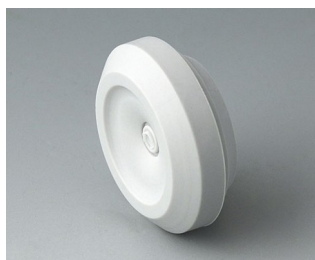
C2320147 Cable grommet TPE light grey RAL 7035