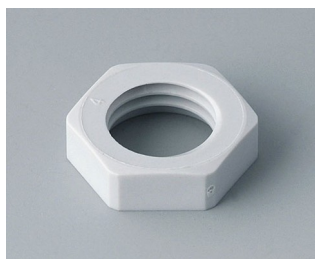
C2312117 Counternut M12x1.5 PA 6 light grey RAL 7035