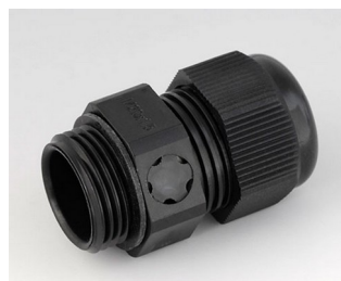
C2320919 Cable gland M20x1.5, pressure compensation PA 6 (UL 94 V-0) black RAL 9005