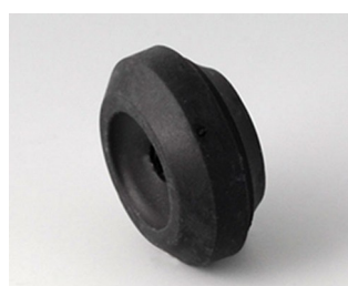
C2316159 Cable grommet TPE (UL 94 V-0) black RAL 9005