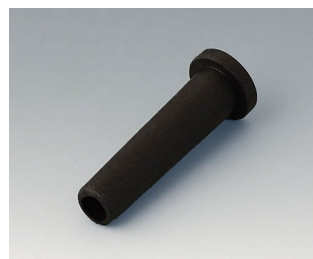
C2353849 Flexible cable grommet Ø 5,3