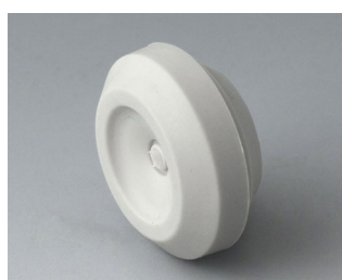
C2316147 Cable grommet TPE light grey RAL 7035