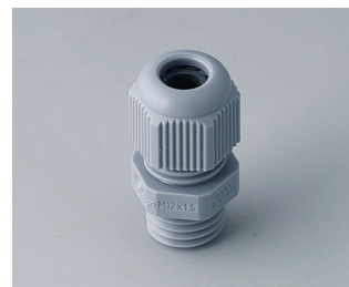
C2312418 Cable gland M12x1.5 PA 6 silver grey RAL 7001