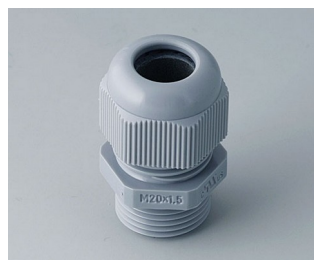
C2320418 Cable gland M20x1.5 PA 6 silver grey RAL 7001