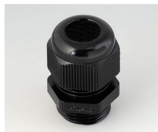
C2320419 Cable gland M20x1.5 PA 6 black RAL 9005