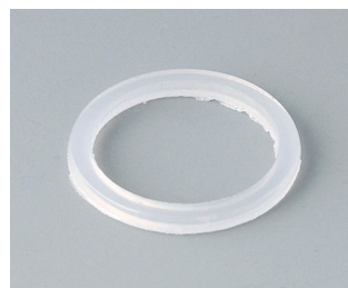
C2316126 Sealing ring for external thread M16x1.5 PE natural-coloured