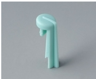
A1105005 Arrow PA 6 (UL 94 HB) lagoon