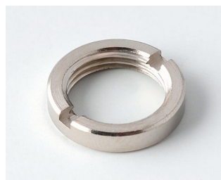
A6295009 Round nut 3/8"-32G

Subject to technical modification without notice. © by OKW Gehäusesysteme, Buchen/Germany.