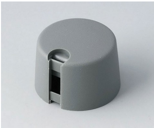
A1024648 TOP-KNOBS 24 PA 6 volcano 24x16mm