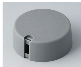
A1040638 TOP-KNOBS 40 PA 6 volcano 40x16mm 1/4"