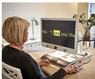
Control knobs for video magnifier

Do obrotowych potencjometrów z końcówkami zgodnymi z normą DIN 41691 lub ze spłaszczonymi końcówkami \varnothing 6/4.6 mm. Urządzenia z segmentu medycznego, pomiary i kontrola, sprzęt laboratoryjny, ogrzewanie i klimatyzacja, sprzęt komunikacyjny, zarządzanie konstrukcjami, itp.