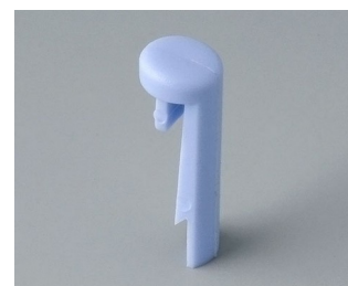
A1101006 Pin PA 6 (UL 94 HB) sky