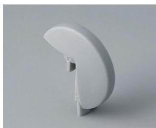
A1103007 Disk PA 6 (UL 94 HB) mineral