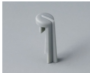
A1105007 Arrow PA 6 (UL 94 HB) mineral