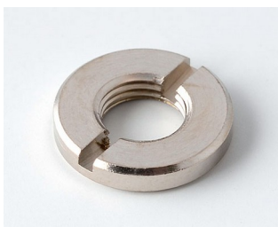
A6207009 Round nut M7 x 0.75