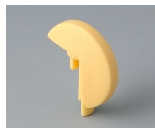
A1103004 Disk PA 6 (UL 94 HB) beach