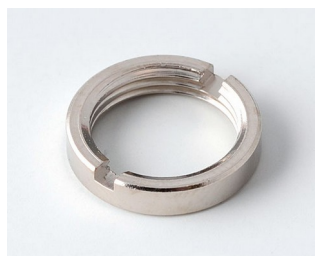
A6210009 Round nut M10 x 0.75