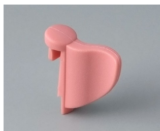
A1104003 Wing PA 6 (UL 94 HB) coral