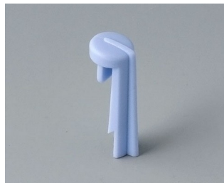
A1105006 Arrow PA 6 (UL 94 HB) sky