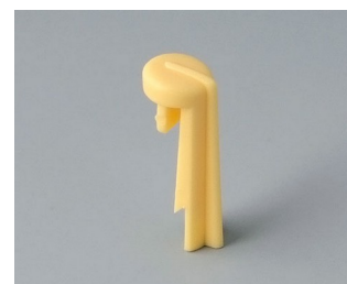
A1105004 Arrow PA 6 (UL 94 HB) beach