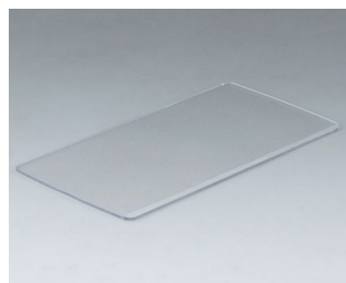
B5503201 Front screen M PC transparent 125,3x63,5x1,3mm