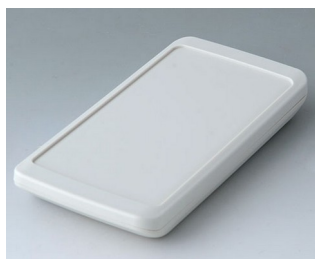
B5403307 SLIM-CASE M, Vers. III ASA+PC (UL 94 V-0) off-white RAL 9002 148x74x19mm IP 65 opt., IP 40