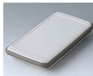
B5403217 SLIM-CASE M, Vers. V ASA+PC (UL 94 V-0) off-white RAL 9002 148x74x22mm IP 54