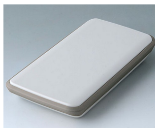
B5403117 SLIM-CASE M, Vers. IV ASA+PC (UL 94 V-0) off-white RAL 9002 148x74x22mm IP 54