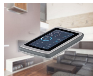
Smart Home Control