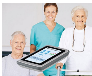
Sensor Checkup System / Monitoring