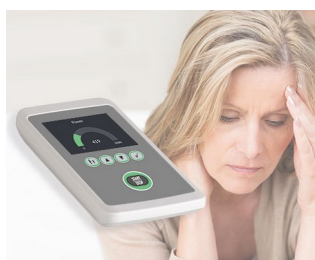
Biofeedback to reduce stress

Idealny do mobilnych zastosowań elektronicznych we wnętrzach, jak również do zastosowań na zewnątrz. Technologie pomiarowe i kontrolne, komunikacja bezprzewodowa, IoT / IIoT, urządzenia z segmentu laboratoriów i medycyny, health care, biura, technologia bezpieczeństwa, technologia ochrony środowiska, itp.