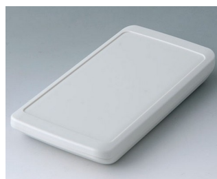
B5403207 SLIM-CASE M, Vers. II ASA+PC (UL 94 V-0) off-white RAL 9002 148x74x19mm IP 65 opt., IP 40