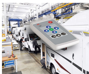
Remote control for interior design