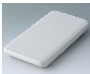
B5403107 SLIM-CASE M, Vers. I ASA+PC (UL 94 V-0) off-white RAL 9002 148x74x19mm IP 65 opt., IP 40