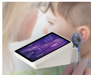
Hearing test device