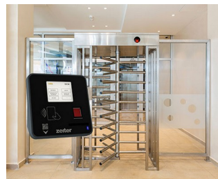
Terminal for access control