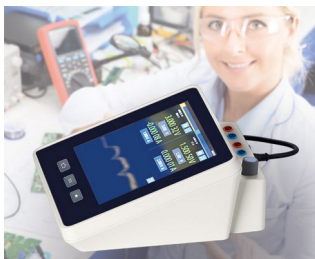
Multimeter measuring device