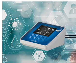
Laboratory measuring device