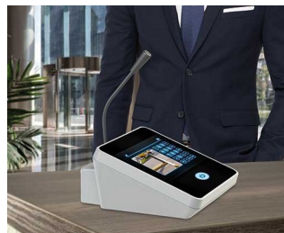
Table microphone / inter phone