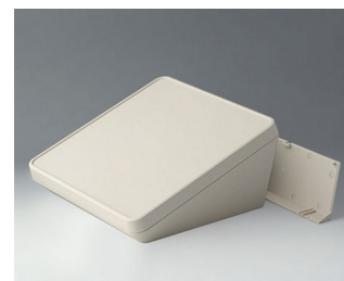
B4422207 PROTEC 220, Vers. II ASA+PC (UL 94 V-0) off-white RAL 9002 220x220x108mm IP 65 opt.