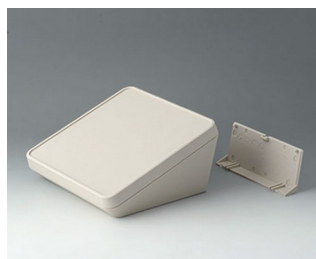
B4418207 PROTEC 180, Vers. II ASA+PC (UL 94 V-0) off-white RAL 9002 180x180x92mm IP 65 opt.