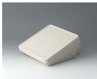
B4418307 PROTEC 180, Vers. III ASA+PC (UL 94 V-0) off-white RAL 9002 180x201x92mm IP 65 opt.