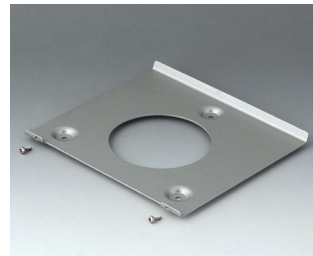
B4522101 Wall suspension element 220 Aluminium