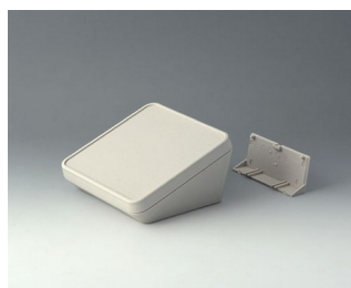
B4414207 PROTEC 140, Vers. II ASA+PC (UL 94 V-0) off-white RAL 9002 140x140x76mm IP 65 opt.