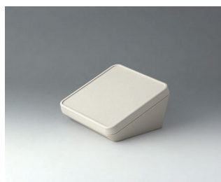
B4414107 PROTEC 140, Vers. I ASA+PC (UL 94 V-0) off-white RAL 9002 140x140x76mm IP 65 opt.