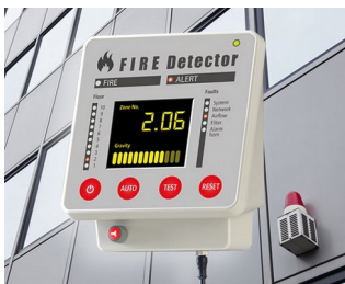
Terminal for fire alarm systems