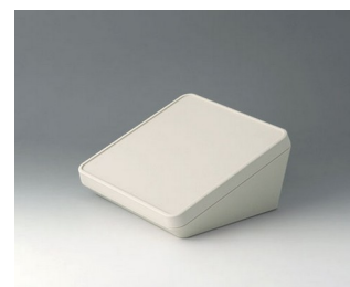
B4418107 PROTEC 180, Vers. I ASA+PC (UL 94 V-0) off-white RAL 9002 180x180x92mm IP 65 opt.