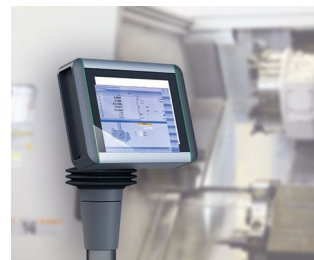
Multi-touch panel for machine control