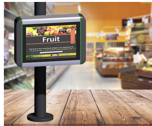
Information terminal at the point of sale