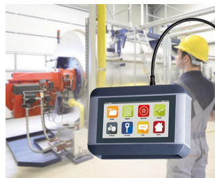
Mobile diagnostic device for machines and plants