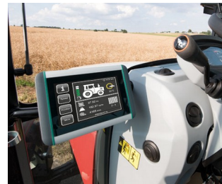
ISOBUS terminal for tractors and self-propelled machines