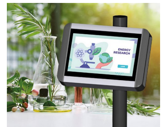
Plant research terminal