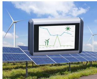
Smart meter for wind power and solar systems