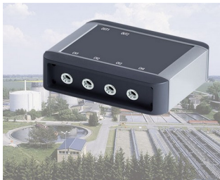
Process control of plants