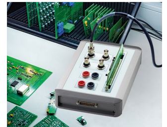
Testing of electronic components