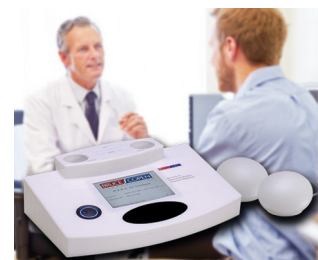
Multiple analytical resonance system