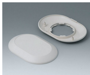
B5015007 Bottom and top part O160 F ABS (UL 94 HB) off-white RAL 9002 160x110x30mm