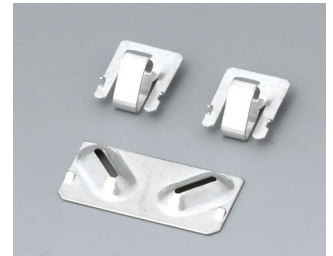
A9190002 Set of battery clips, 2xN/2xAA/2xAAA Steel tin-plated