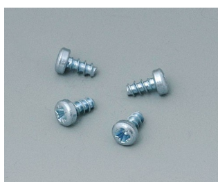
B5111201 Set of screws