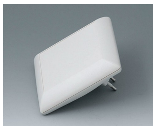
B5013227 ART-CASE S110 F PC+ABS (UL 94 V-0) off-white RAL 9002 110x110x38mm IP 40