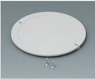
B5011857 Battery compartment lid ABS (UL 94 HB) off-white RAL 9002