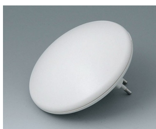
B5011327 ART-CASE R110 H PC+ABS (UL 94 V-0) off-white RAL 9002 ø110x41mm IP 40