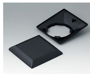
B5012209 Bottom and top part S110 F ABS (UL 94 HB) black RAL 9005 110x110x38mm