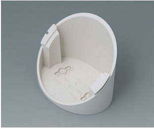
B5011317 Base 55° ABS (UL 94 HB) off-white RAL 9002