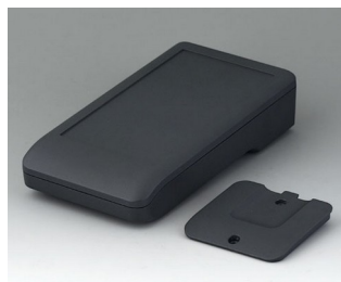
A9006208 DATEC-COMPACT M ASA+PC (UL 94 V-0) lava 172x92x39mm IP 65