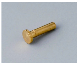
A9193030 Contact pin gold-plated