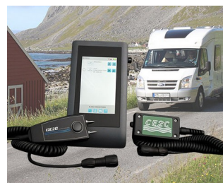
System for leak detection in leisure vehicles