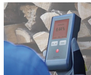
Wood moisture measuring device