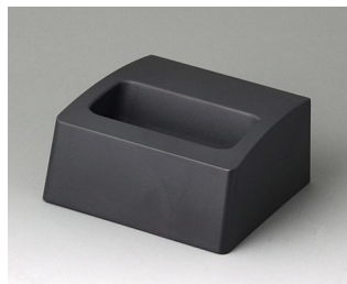
A9105508 Station S ASA+PC (UL 94 V-0) lava