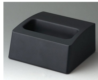
A9106508 Station M ASA+PC (UL 94 V-0) lava