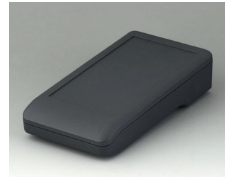
A9006118 DATEC-COMPACT M ASA+PC (UL 94 V-0) lava 172x92x39mm IP 41