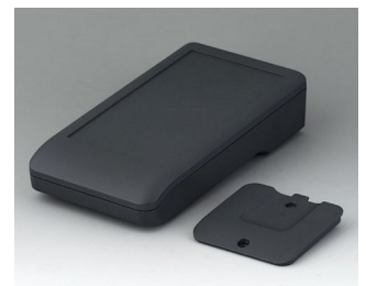
A9006218 DATEC-COMPACT M ASA+PC (UL 94 V-0) lava 172x92x39mm IP 41