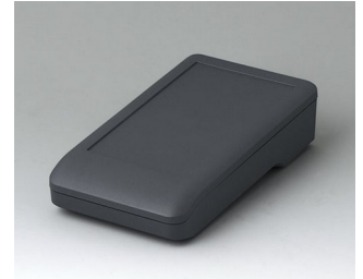
A9005118 DATEC-COMPACT S ASA+PC (UL 94 V-0) lava 136x74x32mm IP 41