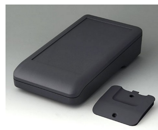
A9007218 DATEC-COMPACT L ASA+PC (UL 94 V-0) lava 206x110x47mm IP 41