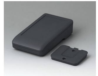
A9005218 DATEC-COMPACT S ASA+PC (UL 94 V-0) lava 136x74x32mm IP 41