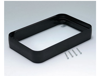
A9153219 Intermediate ring XL PMMA (IR) (UL 94 HB) black RAL 9005 96x154x26mm