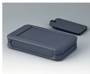
A9052128 SOFT-CASE L ABS (UL 94 HB) lava 73x117x24mm IP 40