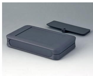
A9053118 SOFT-CASE XL ABS (UL 94 HB) lava 92x150x28mm IP 40