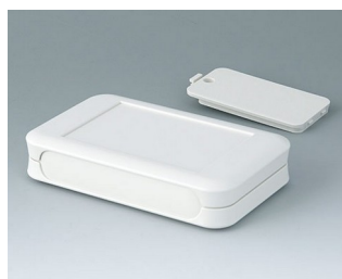
A9052127 SOFT-CASE L ABS (UL 94 HB) off-white RAL 9002 73x117x24mm IP 40