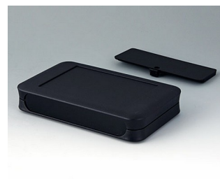
A9053219 SOFT-CASE XL PMMA (IR) (UL 94 HB) black RAL 9005 92x150x28mm IP 40