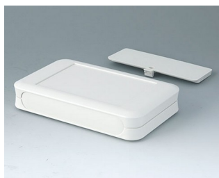
A9053117 SOFT-CASE XL ABS (UL 94 HB) off-white RAL 9002 92x150x28mm IP 40