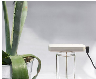
Tool for making colloidal silver solutions